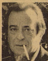
JOSÉ AGUSTÍN GOYTISOLO Escritor.