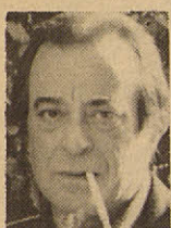
JOSÉ AGUSTÍN GOYTISOLO Escritor.