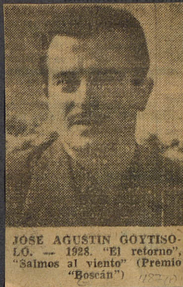
JOSE AGUSTIN GOYTISOLO. -- 1928. "El retorno", "Salmos al viento" (Premio "Boscán") 1187-18