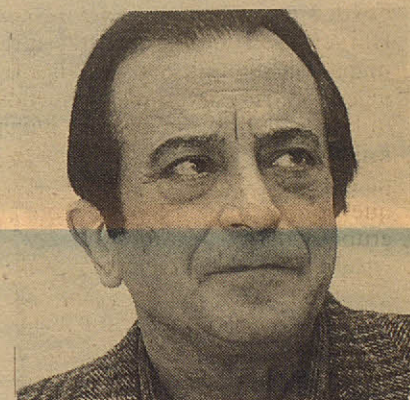
José Agustín Goytisolo

La Hispanic Society of America fue fundada en 1904 por el magnate de los ferrocarriles Archer M. Huntington, con el fin de promover el conocimiento de la cultura española