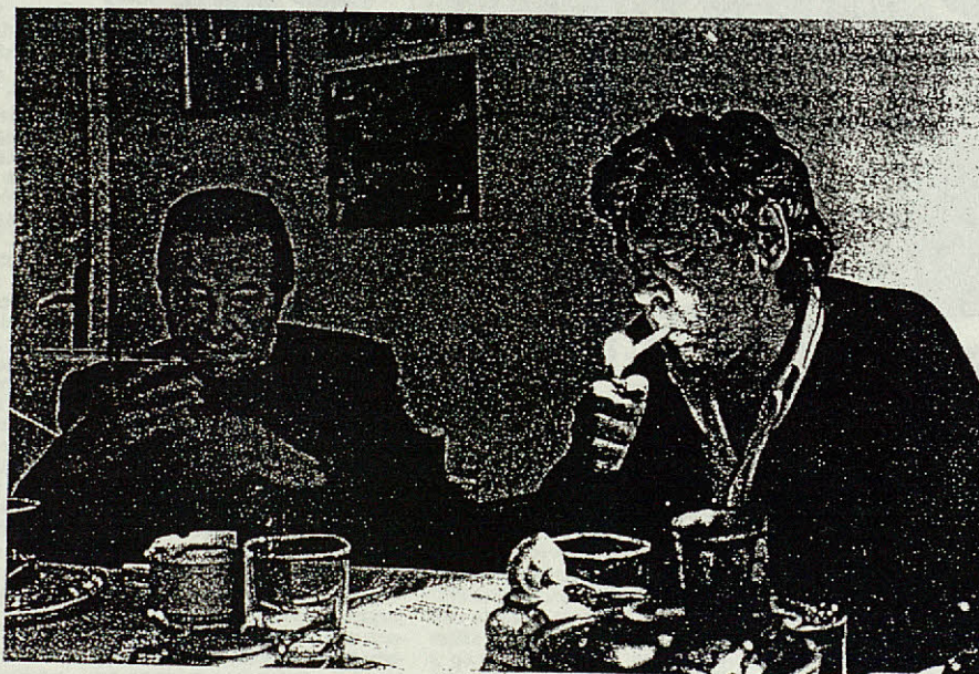
José Agustín Goytisolo y Paco Ibáñez ofrecerán un espectáculo abierto, sin esquemas delimitados

■ Bajo el epígrafe de "La voz y la palabra", el cantante y el poeta ofrecerán a partir de mañana y durante quince días consecutivos, en el teatro Borràs de Barcelona, un singular mano a mano, en el que se desgranarán algunas de las creaciones más conocidas fruto de la colaboración de ambos artistas