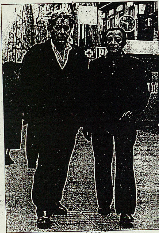
Paco Ibáñez y José Agustín Goytisolo paseando por Barcelona.

El espectáculo La voz y la palabra , que estará en Barcelona hasta el próximo día 30, recorrerá las ciudades de Puerto Rico (23 de abril) y Nueva York (27 de abril) para concluir en Madrid, de los días 1 al 24 de junio en el Teatro Marquina. La música