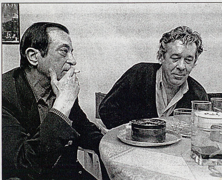
José Agustín Goytisolo y, a la derecha, Paco Ibáñez.

En la primera parte no faltarán, por supuesto, las canciones que Ibáñez compuso a partir de poemas de Goytisolo. “La primera fue Me lo decía mi abuelito , en 1967”, recuerda Ibáñez, “no sé por qué lo hice. Los versos vinieron, llamaron a mi puerta, me dijeron: ‘Somos nosotros’ y yo los dejé pasar... Es difícil explicar el porqué; simplemente lo sientes y piensas ‘eso es una canción’”. “Fue la primera vez que alguien ponía música a mis poemas”, prosigue Goytisolo. “ El lobito bueno y Palabras para Julia las han cantado después otros, pero yo siempre he exigido que fuera con la música de Paco, porque él nunca ha desvirtuado un poema. La primera vez que oí uno de mis poemas cantado por Ibáñez me quedé clavado, fue un amor a primer oído. Le dije: ‘Pon música a todos los que quieras’. Tomar la poesía y convertirla en canción es mucho más difícil que escribir un texto y explicar las cosas banales que suelen explicar las canciones”. “¿Más difícil?”, se queja Ibáñez. “A mí me gustaría escribir los textos de mis can-