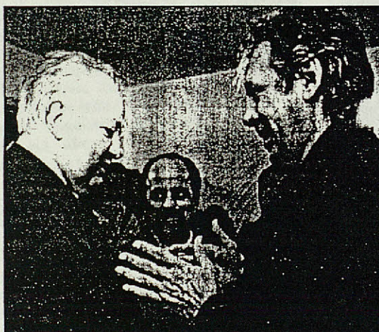
Paco Ibáñez conversa con Mario Soares, el sábado, en Braga (Portugal).

que la temática de sus «duets» es «el desarrollo de las emociones humanas, desde unas primeras composiciones más líricas e intimistas, hasta un final más subido de tono y colectivista, aunque sin afán de hacer proselitismo». Paco Ibáñez reconoce que una apuesta de este tipo supone una novedad y se queja de que «de entrada, la poesía tiene mala prensa porque la gente no sabe que el poeta les canta a ellos; la poesía tiene fama de ser un tostón y romper ese molde es la hostia». Somos el Point Neuff de este país, concluye el cantante.