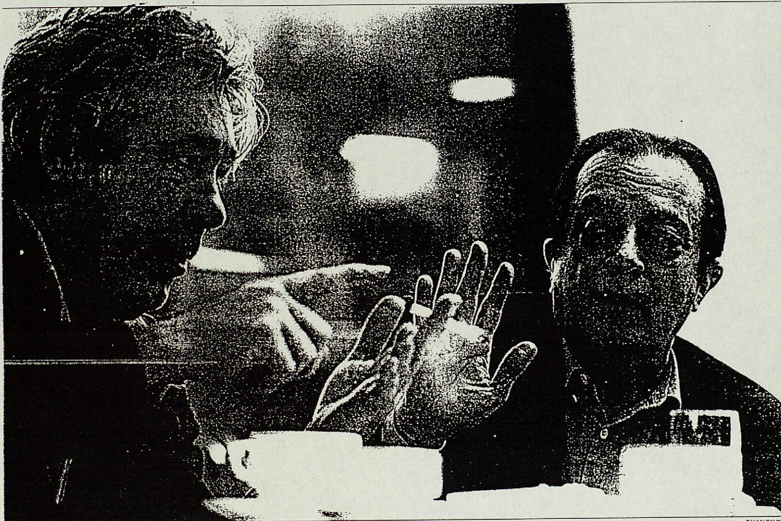
Paco Ibáñez y José Agustín Goytisolo. En la primera parte del espectáculo que presentan en Barcelona intervienen ambos, mientras que la segunda tiene como protagonista único al cantante.

► "El que escribe y el que no escribe deben hacer aflorar todas las emociones"