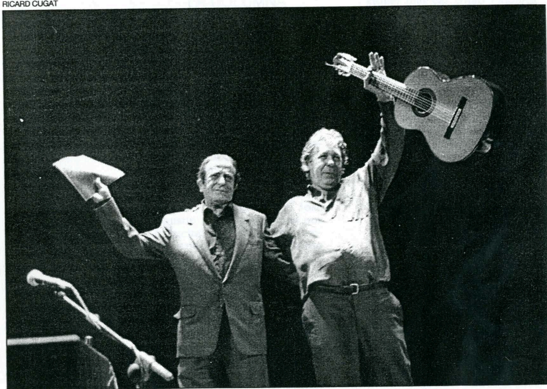
José Agustín Goytisoló y Paco Ibáñez. El poeta y el cantante inician una tanda de recitales conjuntos.

bién actuó aquí, en el Palau Sant Jordi, el 23 de abril del año pasado, en la celebración de los 30 años de la canción Al vent . En esa ocasión, Paco Ibáñez provocó el entusiasmo del público al atacar a la clase política, de-