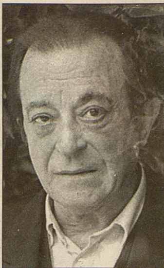
José Agustín Goytisolo.

Veintiún poetas... impone respeto, además del contenido, por el grosor: casi seis centenares de páginas. Son 15 poemas de cada autor con la correspondiente traducción castellana. "Publicar