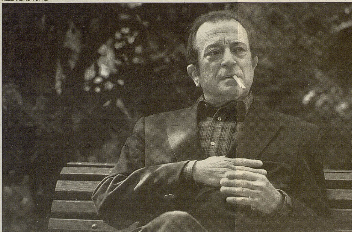
José Agustín Goytisolo, en una fotografía reciente.