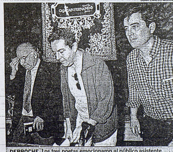
DERROCHE. Los tres poetas emocionaron al público asistente.