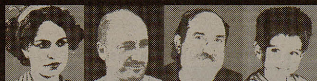
LA MADRE EL PADRE EL ABUELO EL IMBÉCIL