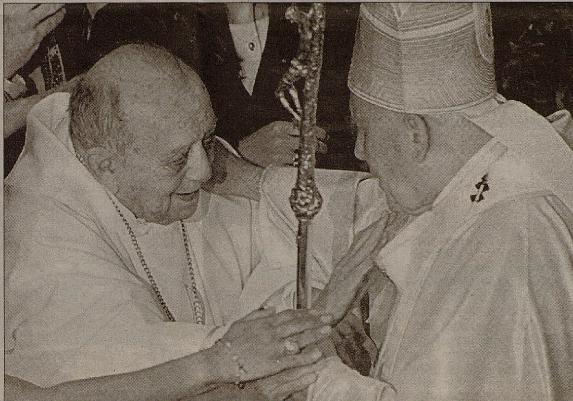
Helder Cámara, amb el papa Joan Pau II, al Brasil, l'octubre del 1997.

ahir el prefecte de la Congregació dels Bisbes, Lucas Moreira Neves, a Ràdio Vaticà.