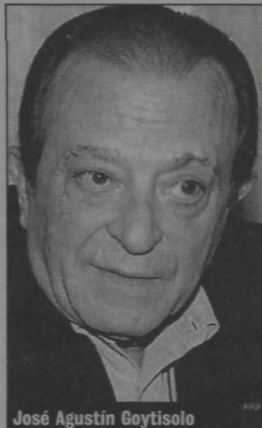
José Agustín Goytisolo

La constatació de les diferències literàries i vitals entre els tres escriptors és un dels elements que més destaquen d'aquest estudi. El mateix Luis Goytisolo, present a l'acte d'ahir, va reconèixer aquesta distància que es va començar a desenvolupar des que eren nens. "Ara, set anys de diferència és molt poc. Però quan un en tenia 10 i l'altre 17, era més d'un terç de la vida". Quant al treball creatiu, mentre que José Agustín es va decantar per la poesia, Juan va optar per la novel·la realista i Luis va preferir una narració més experimental.