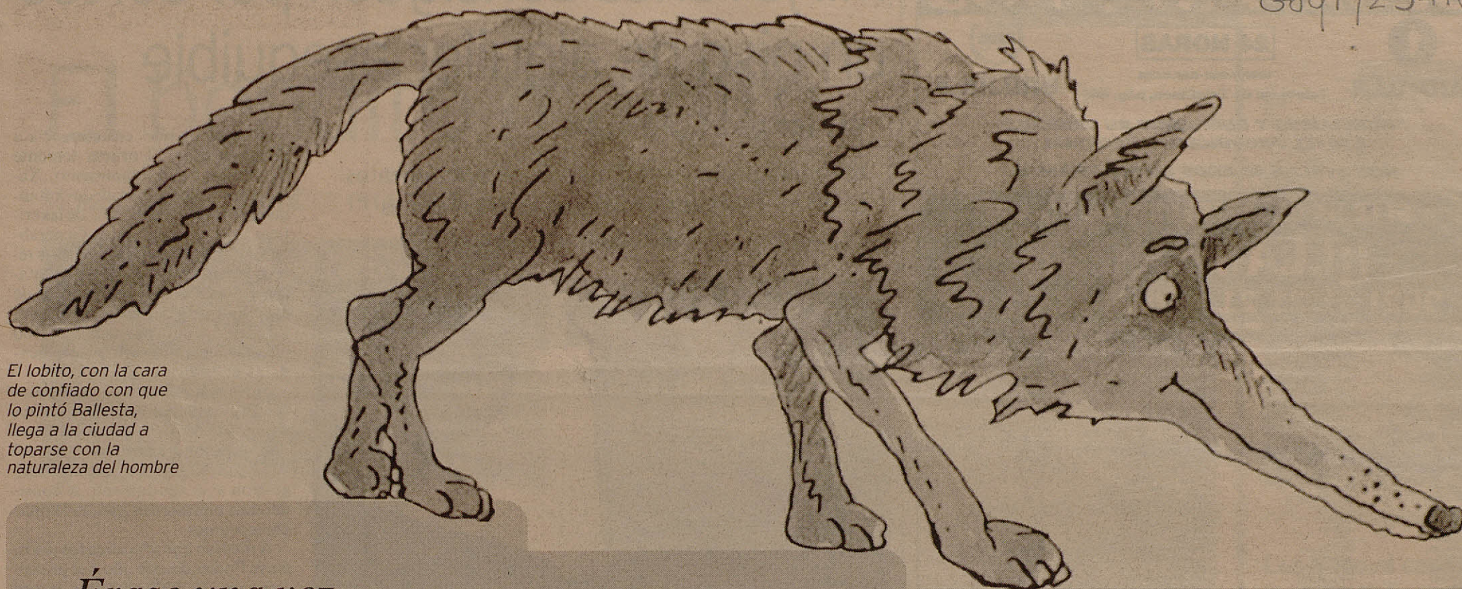
El lobito, con la cara de confiado con que lo pintó Ballesta, llega a la ciudad a toparse con la naturaleza del hombre

Érase una vez un lobito bueno al que maltrataban todos los corderos