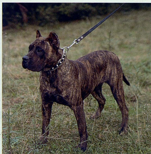
Foto superior derecha Dogo canario.