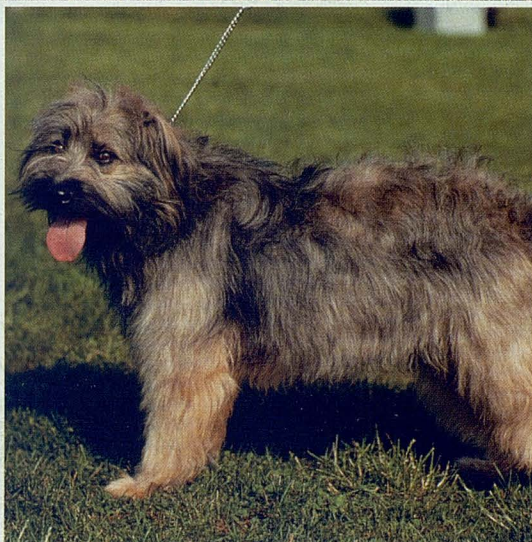
Foto inferior izquierda Gos d'atura català.