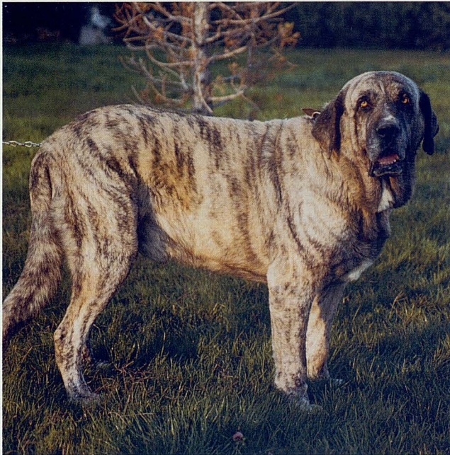
Foto superior izquierda Galgo español. Foto superior derecha Perdiguero de Burgos. Foto inferior izquierda Mastín español.

orden, o la antigüedad, de aceptación por la FCI, y las aún en espera a ser aceptadas, las he situado por orden alfabético. Al lado de cada raza figura el Grupo FCI al que pertenece, y, lo más destacado, el número de ejemplares inscritos en 2004.