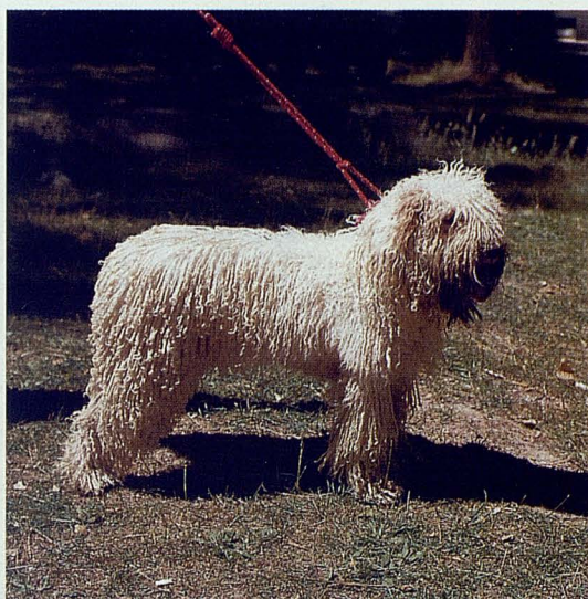
Foto superior izquierda Perro de agua español.