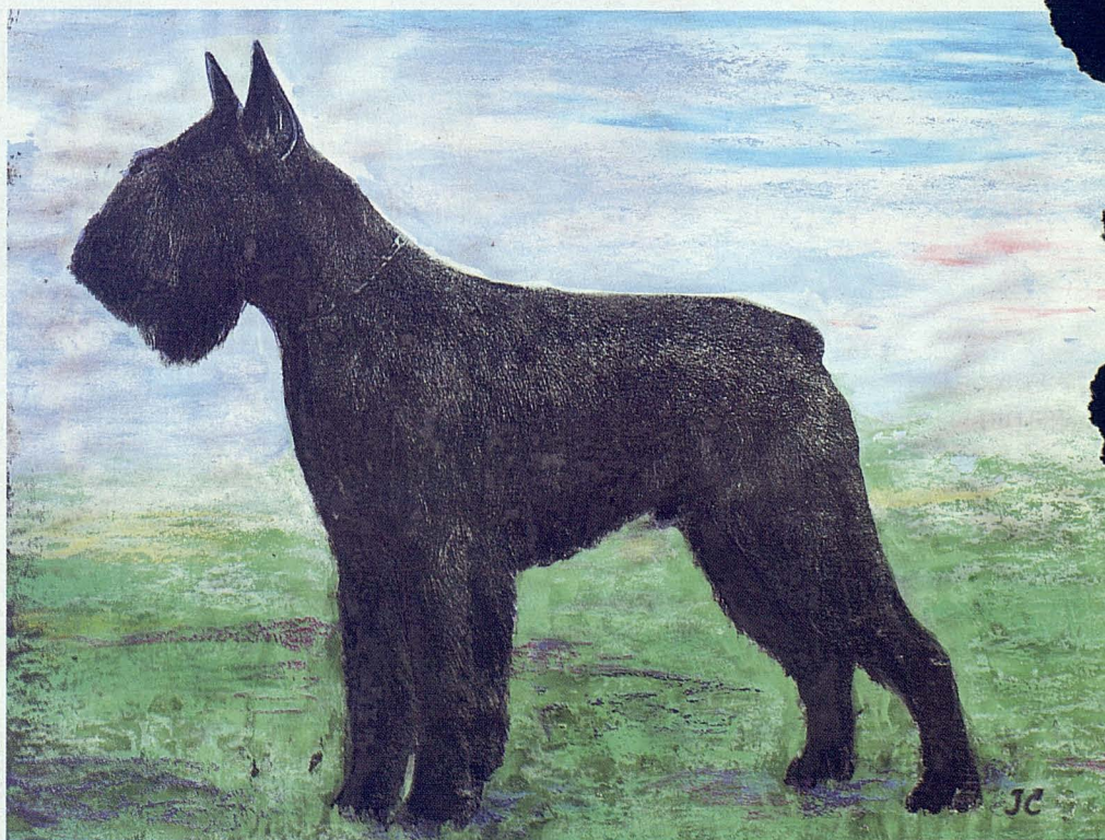
"¿Conoce la raza de este perro?"

Por supuesto no creo puedan aceptarse los apelativos de crueldad, ni de riesgos para los animales, que