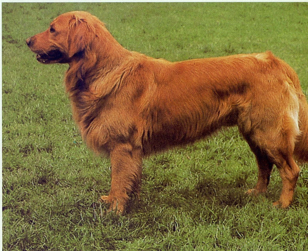
Golden Retriever (orejas colgantes)

De todas formas, con la tecnología genética actual, ya aplicada con éxito en otras especies, podrían devolverse las orejas erectas a las razas en las que se decidiera llevar a cabo