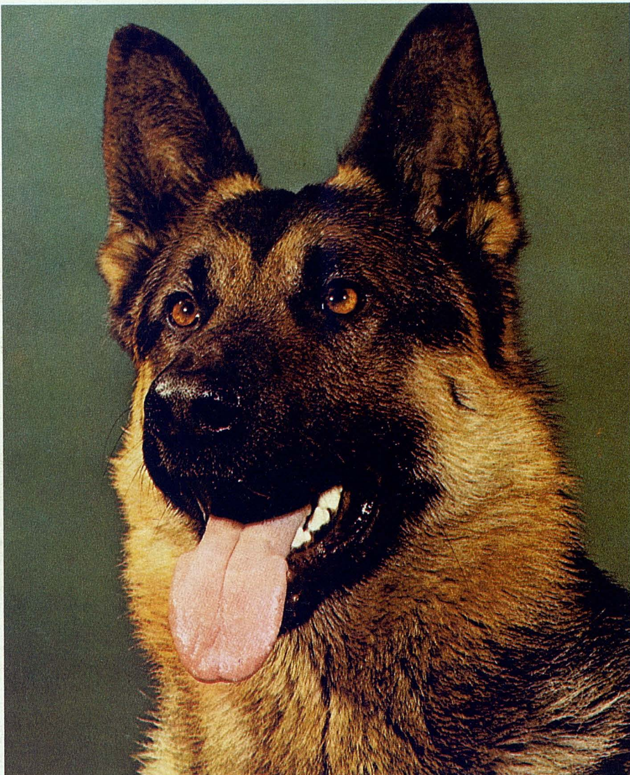
Las orejas típicas del Pastor Alemán

En los mamíferos, con un sistema locomotor terrestre, con patas desarrolladas, la cola fue perdiendo im-