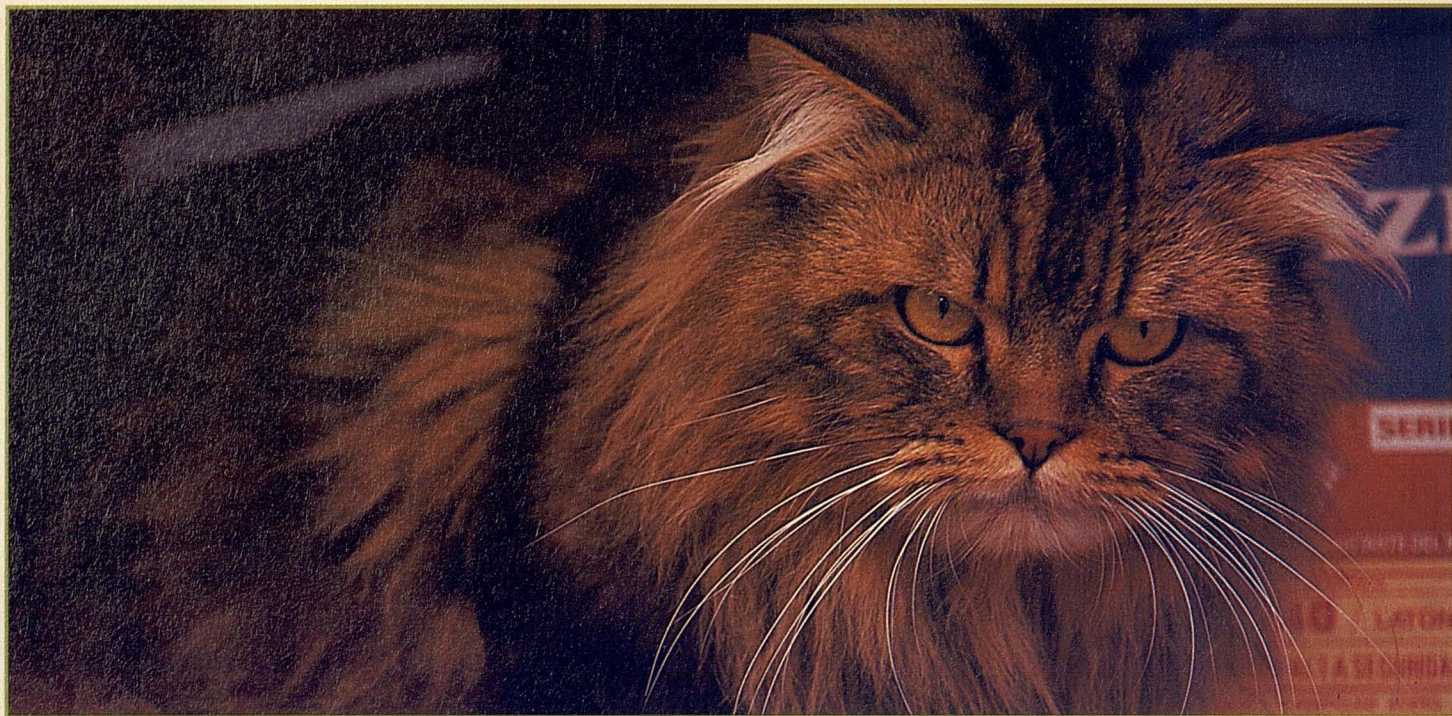
Els gats roseguen molt i qualsevol cosa. Clavar les dents, humides, en un fil d'electricitat, els pot ser fatal.

poden ser regirades, en el jardí o al carrer (és millor que no hi surti) i en qualsevol lloc pot trobar ossos i espines que, trencats, poden ser armes punyents i clavar-se'ls a la gola, o al tracte gastro-intestinal. Cal evitar, per tant, donar-li per menjar parts de pollastre o de conill, ossos de costelles de xai, espines de peix, etc. o bé molta llet, ja que se'ls coagula a l'estòmac i la lactosa els pot ocasionar fortes diarrees.