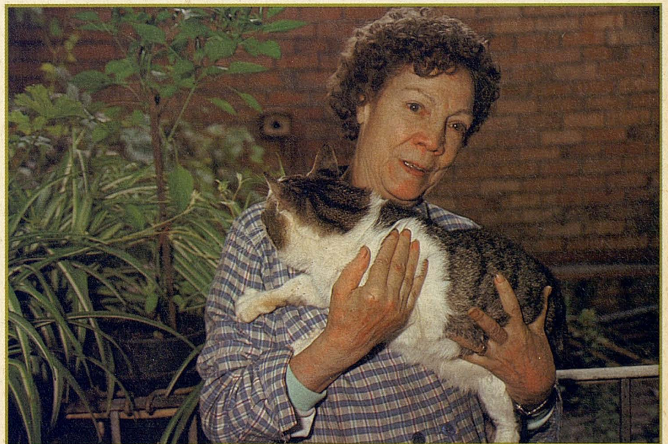
Els gats són juganers i fan servir qualsevol cosa per entretenir-se.

2. El gat és un caçador solitari, i per això li agrada buscar coses de menjar independentment del que tingui en el seu plat o menjadora. Les escombraries