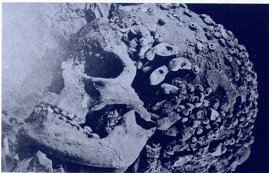
Enterramiento aurignaciense en Cavillón, Liguria (Italia). Luce "caperuza" con unas 200 conchas de molusco y un borde o colgantes con 22 dientes de ciervo. Una línea de ocre rojo (¿desinfectante?) de 18 cm de ancho, cubría el suelo...

Cada una de las religiones públicas, o históricas, definidas como un "conjunto de dogmas o doctrinas, de preceptos o costumbres, y de ritos que configuran sociológica y oficialmente la religión de un grupo humano determinado", (sic, traducido, de la Gran Enciclopèdia Catalana), ha tomado una posición hacia la aceptación de los perros y de los gatos en la sociedad humana. Posturas que han sido muy diferentes a lo largo de la historia. Unas son claramente positivas y otras, especialmente las monoteístas, tienen una visión neutra e, incluso en algunos aspectos, totalmente negativa. Dicotomía que, en parte, habrá llegado hasta la actual sociedad.