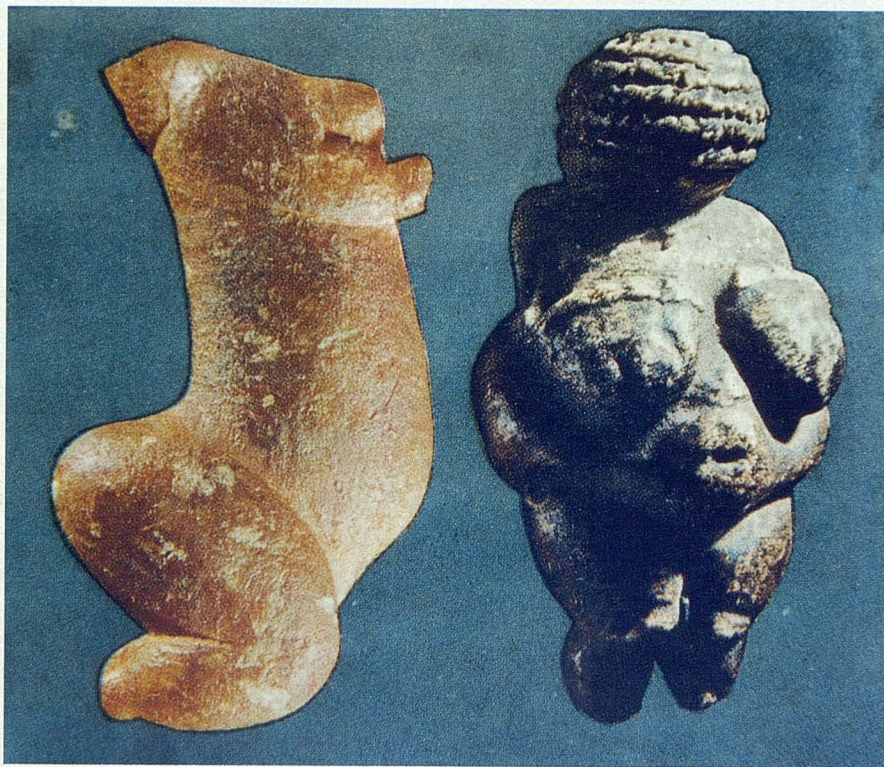
Dos "Venus" o diosas de la fecundidad, de las miles que nos han dejado nuestros ancestros de hace más de 10.000 años en la vieja Europa

las primitivas de centro Europa, a las griegas, y luego a las romanas). Miles de figuras del Neolítico se conservan en museos, con representación mayoritaria femenina, y coinciden con las primeras esculturas de animales domésticos, entre ellas varias sobre el perro.