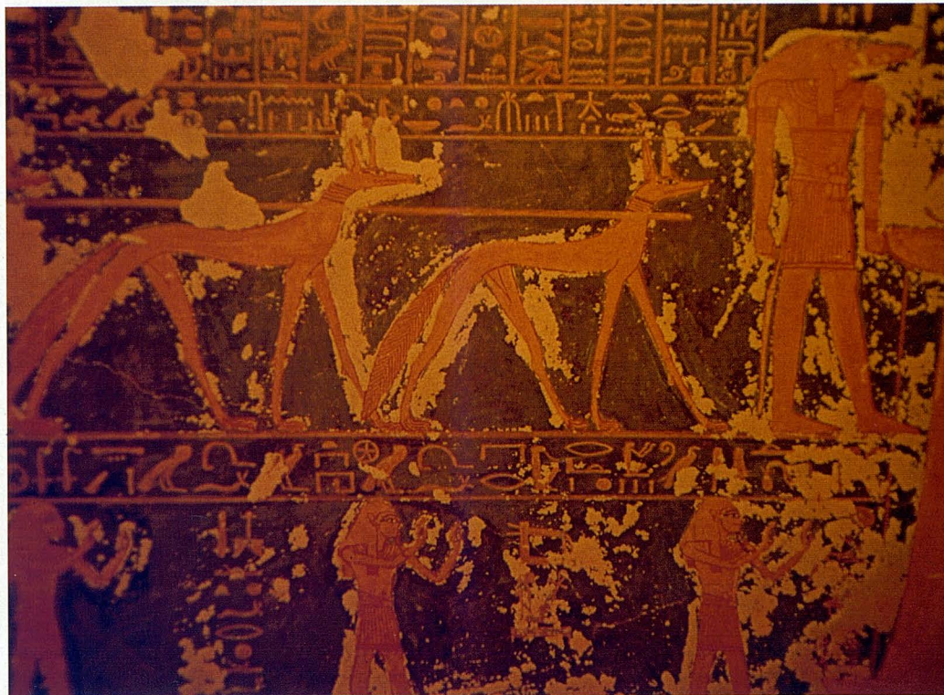
Perros lebreles, de gran altura, orejas erectas y cola poblada, muy distintos a los podencos de cola en rosca, tipo Basenji, mucho más comunes en las pinturas. Ninguno debe confundirse con los chacales que representan al dios de los muertos Anubis. En la Tumba de Ramsés VI., de la XIX dinastía