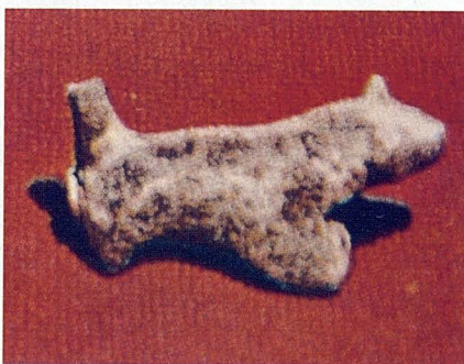
Una de las primeras representaciones de un perro, y en escultura, de principios del Neolítico

Señalo a continuación un estudio breve, que requiere investigación de mayores vuelos, sobre la opinión que se trasluce a través de sus obras de divulgación, o de sus hechos, de las