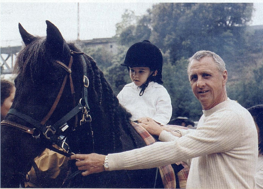
La Hipoterapia se convierte en un buen recurso terapéutico.

« Sólo la acción de cepillar, cuidar o alimentar a un caballo les sirve como fuente de orgullo y entusiasmo »