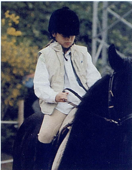
El simple hecho de estar con el caballo supone una ventaja para las personas que siguen esta terapia.