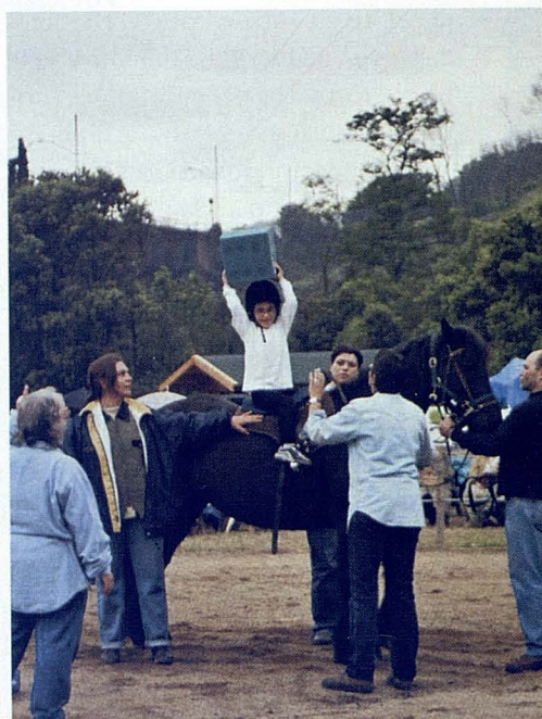
Pista de trabajo mostrando los varios ejercicios realizados.

Es conocido que, los que lo precisan, por el simple hecho de estar con