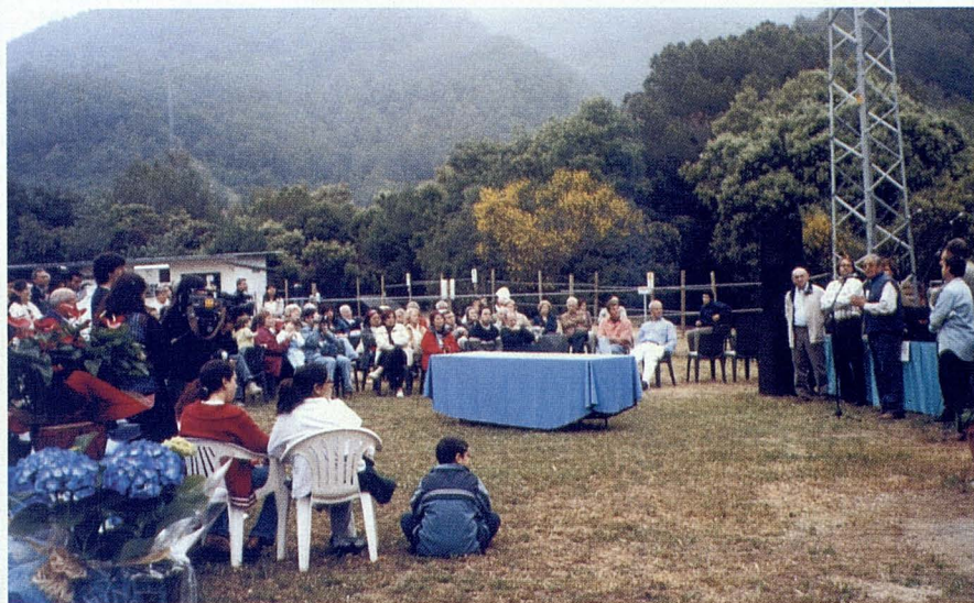
Momento de los parlamentos iniciales para ver el numeroso público asistente.

Con estas actividades terapéuticas con caballos preparados y un equipo multidisciplinar, es factible dar respuesta a alteraciones funcionales y emocionales, consecuencia de varias patologías. Por ejemplo, a las neurológicas, debidas a parálisis cerebral, a esclerosis múltiple, o a hemiplejías. O los problemas de conducta, como problemas en el aprendizaje, a hiperactividad, a déficit de atención, o a retraso psicomotriz. También los enfermos crónicos, oncológicos e inmunodepresivos. Asimismo, los psiquiátricos, de tipo residual y salud mental, los que tienen estados depresivos, lesiones medulares, traumatismos craneoencefálicos, déficits sensoriales, secuelas de polio y un largo etcétera.