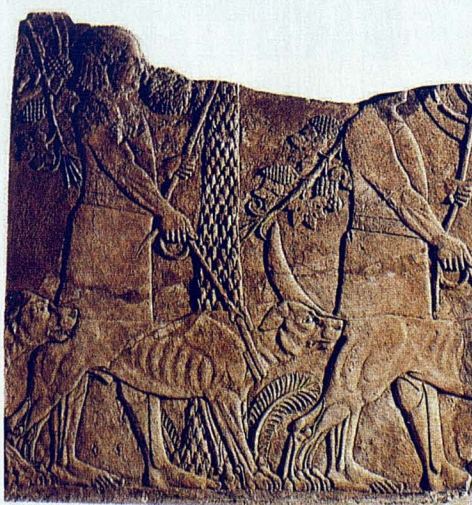
Bajorelieve "auténtico" del muro del palacio asirio de Asurbanipal en Nínive (del año 640 antes de Cristo). Aunque hay varias representaciones de perros molosos, mil años más antiguas, que proceden del Egipto faraónico.

Ya podemos afirmar, por estos datos, que las imágenes de los perros molosos del palacio asirio de Asurbanipal tienen una antigüedad de 2.640 a 2.645 años. Sin embargo, no son las primeras representaciones de molosos, ya que, en Egipto, tanto en estatuas como en pinturas y bajorrelieves, hay claras muestras de perros de tanta alzada, y potencia. Perros que proceden, nada menos, desde inicios del Imperio nuevo. Hace, por tanto, más de 3.500 años. Mil más que las asirias.