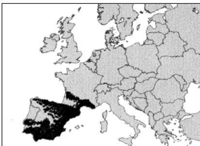
Fig. II - Mapa de ocupación del conejo desde el final del Paleolítico Superior, y todo el Neolítico ( La parte negra corresponde con las áreas ocupadas durante el Imperio Romano).

Los niveles eneolíticos del Sur y los del Norte y del Levante de la península ibérica, y los del sur de Francia, son los más abundantes en restos paleozoológicos, comprobados, de la especie que comentamos. No parece existan referencias de restos en otras partes del mundo, de antes o durante las glaciaciones. (Gibb 1.990).