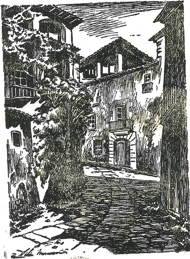
Antigua Plaza d'En Guin de Vich. («Ad capud callis Judeorum»).

una calle de la población, y por el N. con diferentes casas, se concede la facultad a los judíos beneficiarios de la parte de huerto «establecido» para edificar allí casas, la Escola y todo lo que gustaren, o sea, que se proyecta contruir en aquella parte de huerto la Escuela o Sinagoga (3). Muy probablemente la Sinagoga o edificio