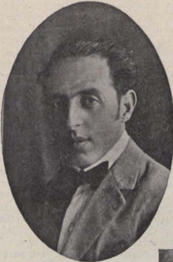
El pintor F. Guinart

Ramon Sunyer. — Potser estem poc avesats a donar a l'argenteria i l'orfebreria tota la valor artística que té, malgrat la gloriosa tradició amb que compta a casa nostra.