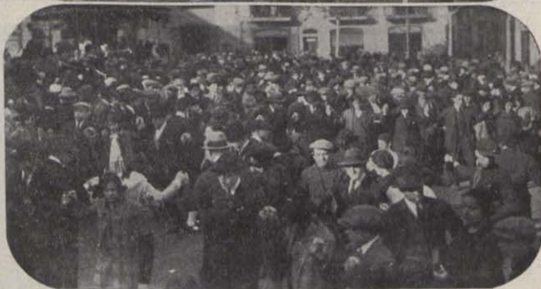
8.—Berga: Ballades a racer del San- tuari de Queralt.