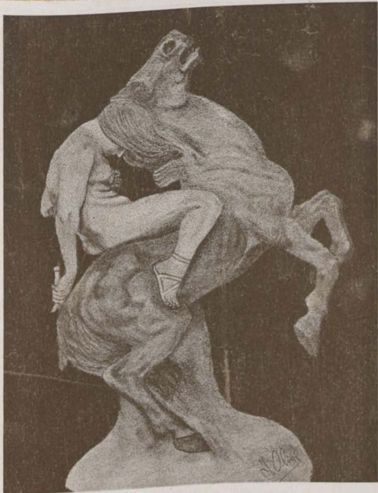
(Dibuix al carbó de J. Ollvé)