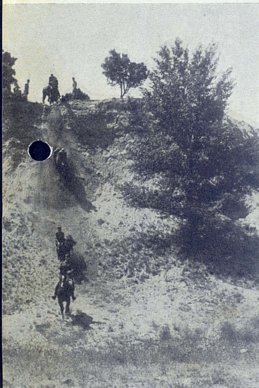
Bajada de cortaduras

Las clases teóricas consisten en el estudio del reglamento de Equitación, Doma, Hipología, Marchas y Zootécnia.