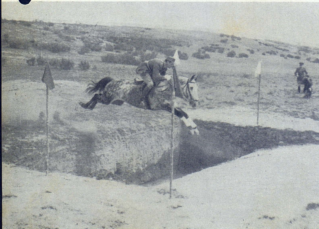
Salto de un obstáculo en el campo