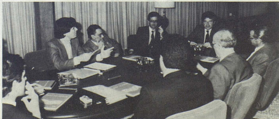
Instantánea de la deliberación para la concesión del "I Premio Uriach de Historia de la Veterinaria".

El Laboratorio URIACH, en un intento de revalorizar el pasado de la profesión, convoca para 1985 un segundo concurso para trabajos sobre Historia de la Veterinaria.