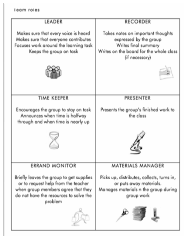
Figura 3. Descripció dels rols dels grups cooperatius inclosa en els materials escolars. Curs 2007-2008

Tot i que els grups duren setmanes, és a dir, que se'ls podria considerar grups cooperatius de base, l'estratègia dels rols s'utilitza de forma informal, ad hoc; els alumnes decideixen per ells