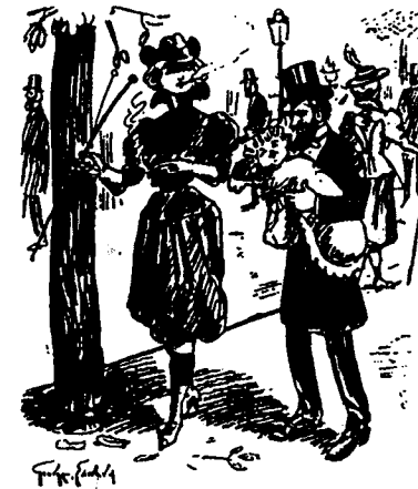
Canne à la main, cigarette à la bouche, culotte au...tre part, le voilà le féminisme de demain. 1

Il y a plus grave: la femme émancipée refuse le fardeau de la maternité, et sur les boulevards c'est le pauvre mari qui doit se charger de Bébé. On voit la portée de cette dénonciation : la culotte produit des mères dénaturées, des mantes religieuses, dévoreuses de mâles.