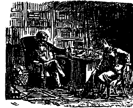
QUESTION EMBARRASSANTE. Le vieux monsieur.-Avant de répondre à votre proposition et de donner ou non mon consentement à votre mariage avec mon fils, je dois tout d'abord vous demander si vous êtes dans une situation qui puisse vous permettre de faire face aux multiples exigences d'un ménage. 1

A une époque où la plupart des professions sont interdites aux femmes, il est évident que la question restera sans réponse: on prétend ainsi démontrer par l'absurde l'inutilité des campagnes féministes.