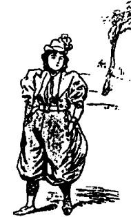
Les mains dans les poches. Culotte flottant au vent 1

Bref, pour les caricaturistes la femme en culotte redonne vie à un thème classique, celui du monde à l'envers : la femme déguisée en homme apparaît