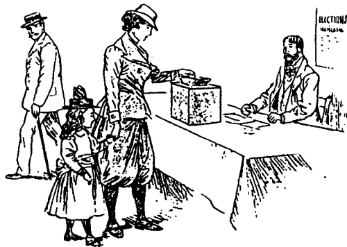
La femme future. La mère initiant sa fille aux devoirs de l'existence. 1

Enfin, cette femme arrogante réclame le droit de vote, revendication choquante pour la Droite conservatrice, bien sûr, mais inquiétante pour la Gauche républicaine qui craint que l'électorat féminin, endoctriné par le clergé catholique, n'exprime majoritairement un vote réactionnaire. On peut par progressisme refuser (provisoirement) le droit de vote aux femmes! En pratique, les revendications des suffragettes se heurtent donc à une union sacrée de la classe politique, consciente de la montée des périls.