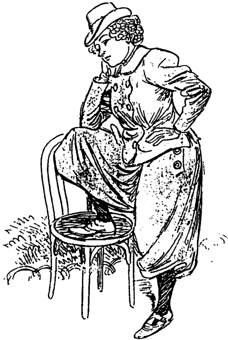
Poses et gestes masculins: Accoudement familier et jambe relevée. 1

comme une usurpatrice, qui subvertit les rôles sociaux et instaure à l'intérieur du couple une nouvelle hiérarchie. L'émancipation de la femme n'est pas doncue comme une marche vers l'égalité des sexes, mais comme une revanche humiliante sur les hommes.