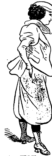
Poses et gestes masculins: Les mains dans les poches.

le cigare), bénéficie peut-être de l'indulgence du milieu littéraire et artistique, mais suscite malaise et réprobation.