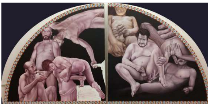
Raúl García Sangrador, retablo "El instante eterno" (detalle), Óleo/tela, 2017.

Del lado derecho está un personaje anónimo con lipodistrofia facial, la cual evidencia su tratamiento con inhibidores de la proteasa. El módulo del centro representa la zona de regaderas, en donde todos ya están desnudos e inician las miradas entre los asistentes. Los módulos superiores forman un medio punto, en referencia a los retablos religiosos en Puebla. La intención inicial fue engranar las corporalidades mórbidas y eróticas representadas en la pintura del barroco poblano, junto con los cuerpos de los parroquianos asistentes a los saunas de la misma ciudad. El deseo de los Cuerpos sin Órganos de Deleuze es el referente que es tratado pictóricamente. Los cuerpos de los módulos superiores no tienen color, porque el baño turco y el vapor son en sí cuartos oscuros, no se ven detalles, todo es un cuarto de carne. Los presentes son máquinas deseantes, ansiosas de conectarse con los flujos que ahí intervienen. Pienso que este retablo es el primero de varios que realizaré en el futuro; podría pintar tantos como espacios de este tipo existen alrededor del planeta, cada uno con sus propias particularidades, fisonomías, contextos, texturas, olores y colores corporales. Sólo pensar en el tamaño del proyecto me eriza la piel y me emociona... así que ya conseguí el bastidor nuevo y he iniciado a pintar.