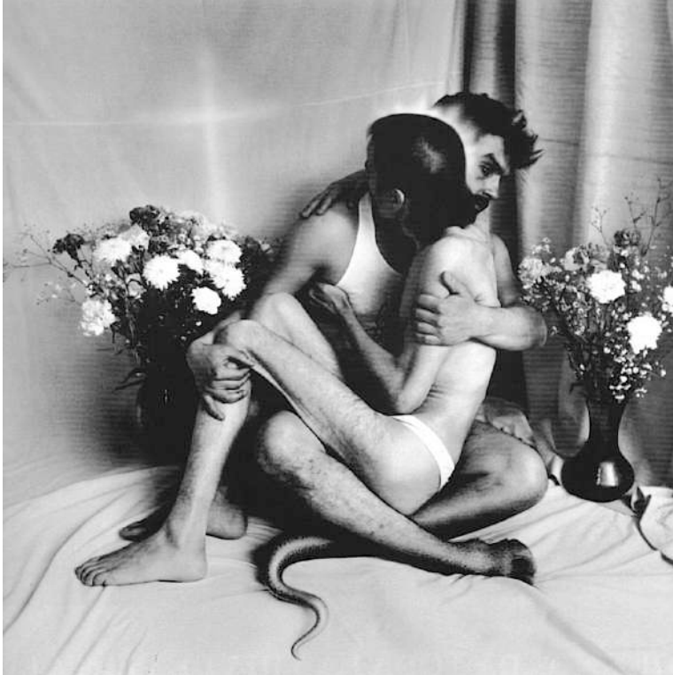
TDV, “Jesús y el Diablo”, Fotografía intervenida, 1992-94 (Taller de Documentación Visual UNAM, 2004: 461).

referencia. Las fotografías bien podrían ser las estampas y láminas que se compraban en las papelerías de la esquina.