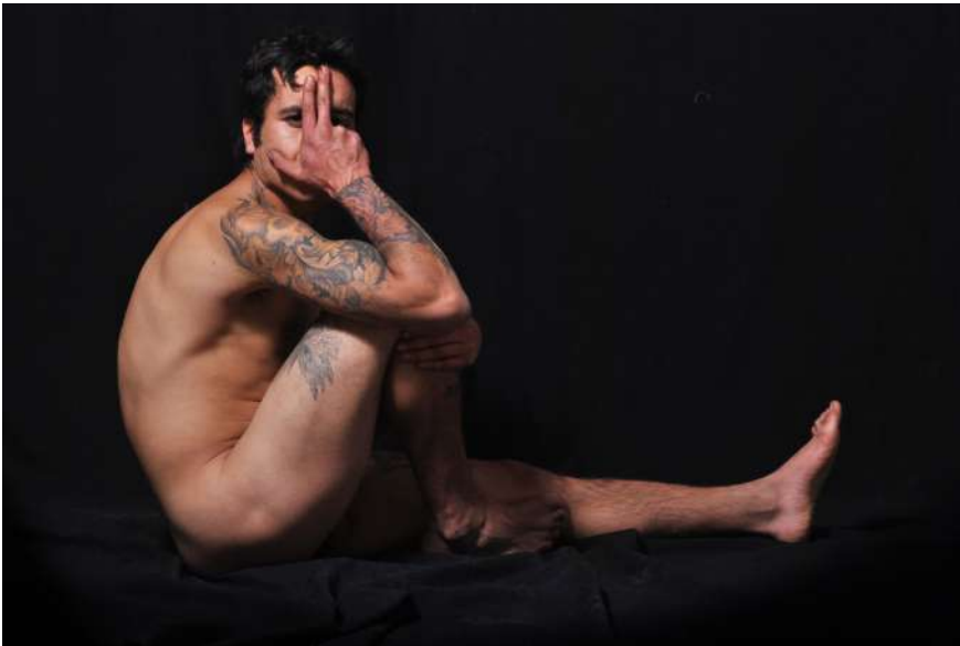
Raúl García Sangrador, “Víctor”, fotografía digital, 2013.

La intención del presente texto es hacer un alto en las consecuencias visuales que se pueden observar en quienes —al igual que los soldados de Odiseo que se volvieron lotófagos— se han olvidado de la misión de vida que se habían planteado y hasta de sí mismos. Pareciera, de entrada, que también cabe la posibilidad de romantizar la adicción a ciertas sustancias, revistiéndola de poética, como hicieron el sentimiento romántico decimonónico y movimientos adyacentes, como por ejemplo el simbolismo francés. Inmediatamente aparece un sesgo que invita a