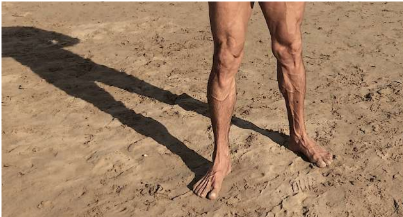
Raúl García Sangrador, "Lipodistrofia", fotografía digital, 2015.

En 1997 se incluyeron los inhibidores de la proteasa, y con ese hecho apareció por primera vez en la historia de la humanidad una nueva corporalidad: la matizada por la lipodistrofia, que en sí es una reacción secundaria de los citados inhibidores. No es posible predeterminedar quién la padecerá de manera ligera o severa, o en qué parte del cuerpo ocurrirá. En muchos casos los efectos se ven en la cara, porque se pierde la grasa subcutánea de las mejillas, de modo que quedan hundidas, se forman pliegues de piel magra que van del pómulos al maxilar inferior. Incluso existen clínicas de cirugía estética donde se oferta reinstalar esa grasa facial perdida, para que el paciente recobre una apariencia más natural.