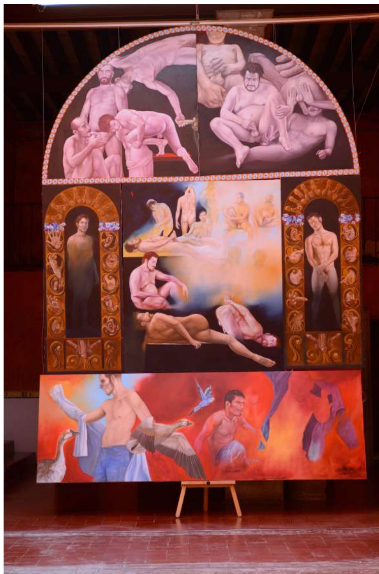
Raúl García Sangrador, retablo "El instante eterno", Óleo/tela, 300 x 410 cm, 2017.