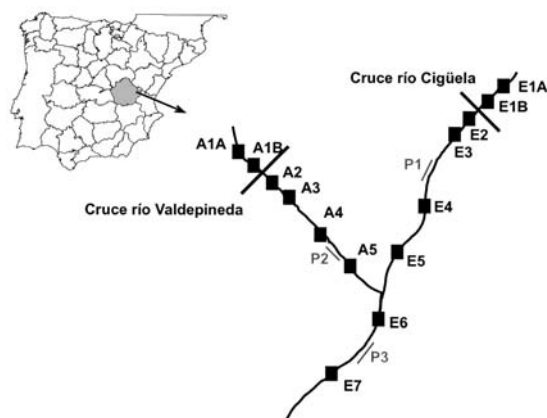
Figura 1. Esquema del área de estudio y de las distintas estaciones de muestreo (T.M. Horcajada de La Torre, Cuenca). Scheme of the location of the study area and sampling sites (Horcajada de La Torre municipality, Cuenca).

El ámbito de estudio se sitúa en el Término Municipal de Horcajada de La Torre (provincia de Cuenca), España. El proyecto se desarrolla en dos tramos de aproximadamente 1.000 metros de longitud en el río Cigüela y su afluente Valdepineda, en la cuenca del Guadiana (Fig. 1). Estos ríos muy antropizados tienen en su mayor parte una anchura media de 1 m y una profundidad media de 80 cm. En sus lechos hay un depósito de sedimentos finos de aproximadamente 30 cm de espesor, exceptuando las cuatro primeras estaciones del río Cigüela y la cuarta estación del Valdepineda, donde la profundidad es de unos 30 cm sobre arenas gruesas, gravas y cantos. Estos ríos lavan materiales yesíferos presentando, por tanto, un carácter marcadamente salino con un grado de mineralización superior a 2.000 \mu\text{S}/\text{cm} y con un pH próximo a la neutralidad. Sus aguas se clasifican como sulfatadas cálcicas y ligeramente magnésicas según Shtchoukarev (Catalán La Fuente, 1981) en el Cigüela. La media de los valores de sólidos en suspensión encontrados a lo largo de un año de estudio son mayores en el río Valdepineda que en el Cigüela, 27.6 (5.4-273.5) frente a 7 (1.3-24.8) \text{mg}/\text{l} (entre paréntesis el rango en el que