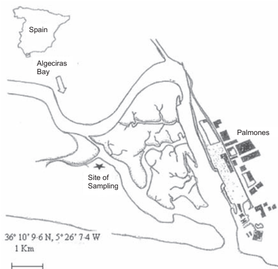
Figura 1. Estuario del río Palmones y zona de muestreo. Palmones River Estuary and sampling zone.

cimiento (Mendelson, 1979; Debusk y Reddy, 1987; Caetano et al. , 2007). La mayoría de las plantas toman el nitrógeno a través de las raíces desde el suelo como \text{NO}_3^- ó \text{NH}_4^+ , mostrando una alta afinidad por el \text{NH}_4^+ como forma de nitrógeno para ser asimilado (Morris, 1980; Morris, 1984; Jampeetong y Brix., 2009 (en prensa); Simas y Ferreira, 2007) mientras que el \text{NO}_3^- juega un papel menor en la nutrición de la planta, aunque cuando está disponible, las plantas muestran la capacidad de asimilarlo (Mendelsson, 1979). La preferencia por el amonio podría ser debida a que la energía requerida para la reducción de nitrato se ahorra mediante la incorporación de amonio (Rosenberg y Ramus, 1984), aunque según diversos estudios, la capacidad de almacenamiento del amonio en la planta es limitado debido a su efecto tóxico (Waite y Mitchell, 1972; Haines y Wheeler, 1978; Lotze y Schramm, 2000; Cohem et al. , 2004).