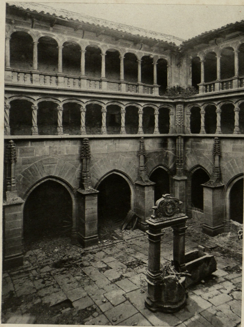
CLAUSTRE DEL CONVENT DE SAN FRANCISCO BELLPUIG.