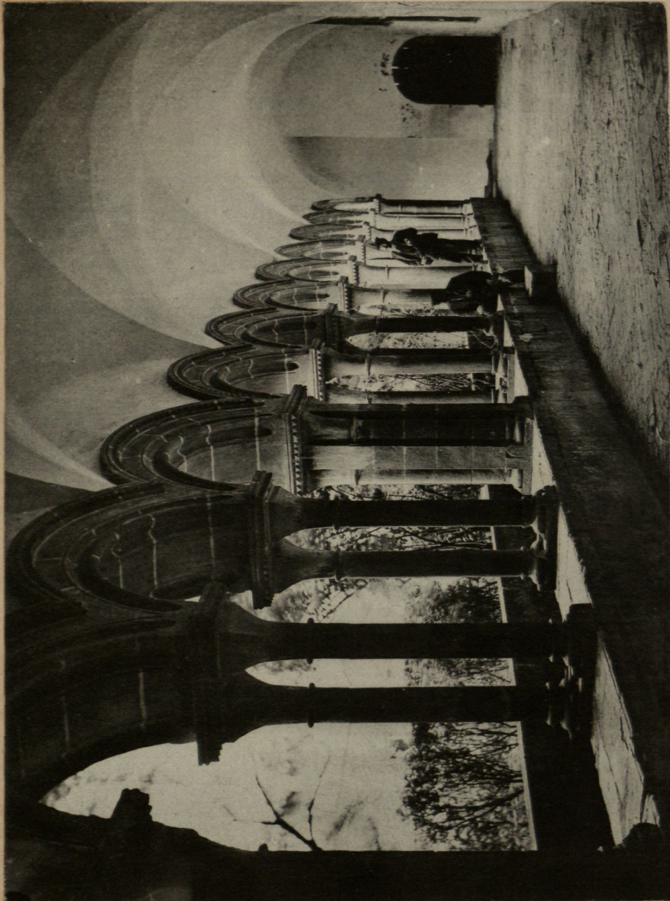
CLAUSTRE DEL MONESTIR DE LAS AVELLANAS