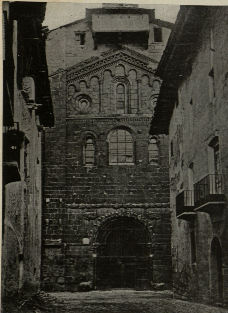
FRONTIS DE LA CATEDRAL DE LA SEU D' URGELL