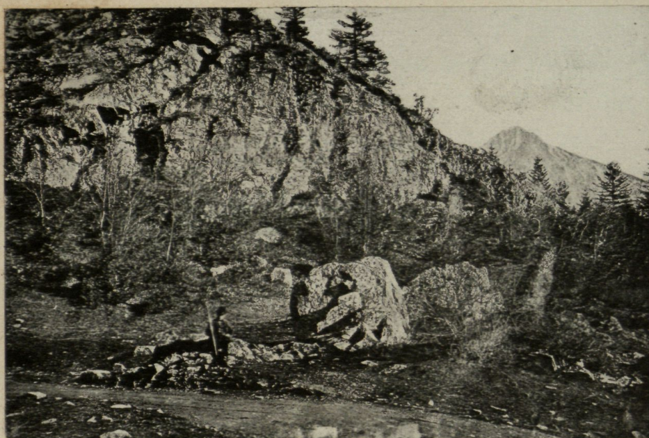
LO COLL DE PORTILLON DE BURBE