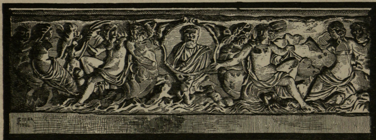
Bany romá, que 's guarda en la Iglesia parroquial d' Ager.

«Entrando por la puerta de mano izquierda, continúa diciendo Villanueva, se encuentra un baño romano de mármol, de nueve palmos de largo por tres de ancho y altura. Está empotrado en la pared y solo presenta dos costados con varios relieves de tritones y monstruos marinos. En el centro del costado principal hay un óvalo con una figura togada que tal vez será por quién se construyó ó será otra cosa. Mejor lo diría un dibujo, si mis facultades alcanzasen á sacarlo mas exacto y digno de la luz pública, que el que hizo en 1780 Don Juan Mercader, racionero de esta iglesia, el cual me ha regalado su hermano Don Salvador, mi bienhechor y huesped. Lo mas singular de este monumento de la antigüedad es el uso cristiano á que está destinado; porque en él, como en Tarrasa y otras partes he visto, está guardada y cerrada la pila baptismal. Esto y el verlo arrimado á la pared maestra de la iglesia, hace sospechar que debió servir para el mismo objeto en tiempos en que se administraba el bautismo per inmersio-nem .»