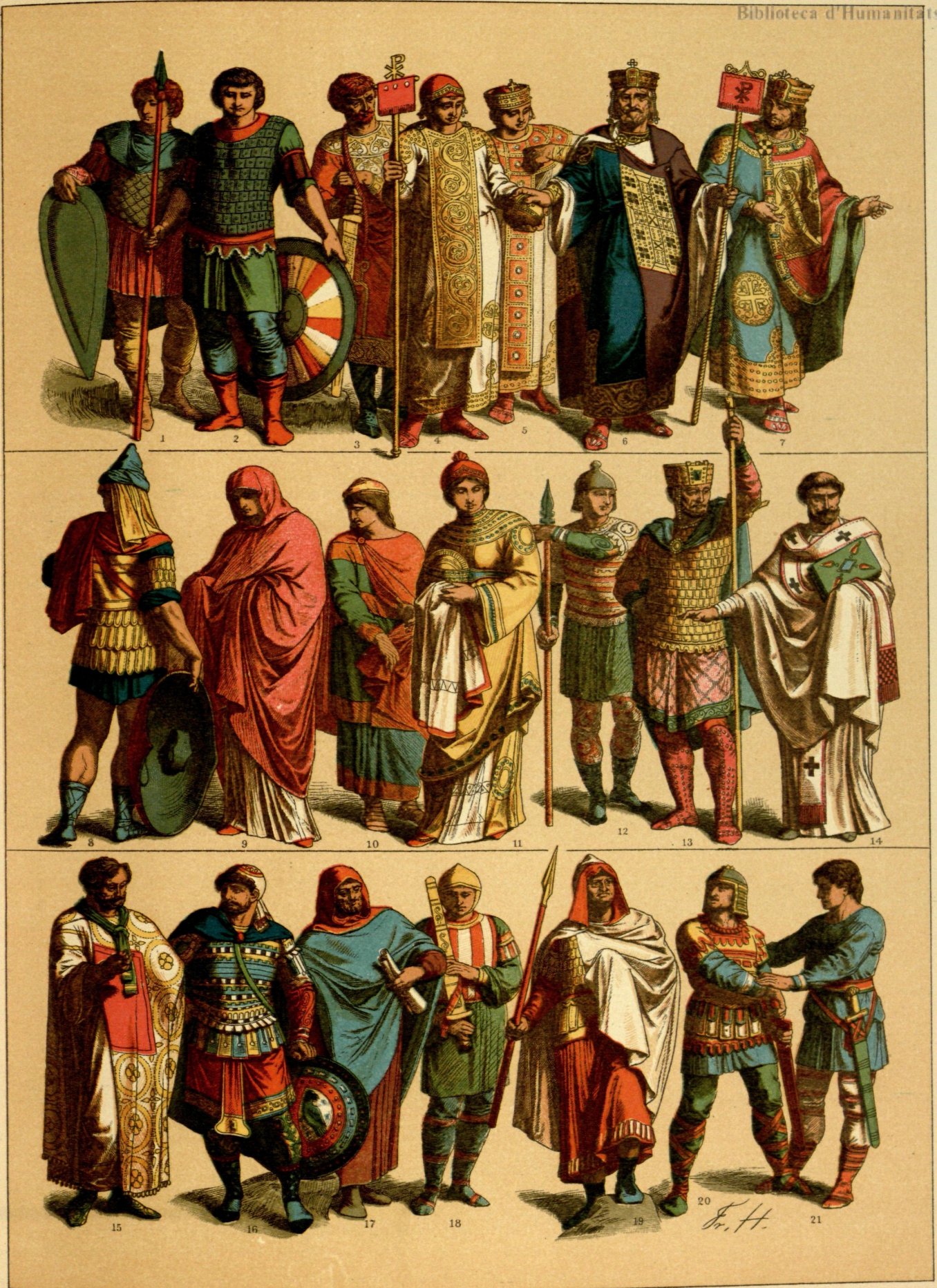
EDAD MEDIA. - TRAJES Y ARMAS DE LOS BIZANTINOS DESDE EL AÑO 700 AL 1000