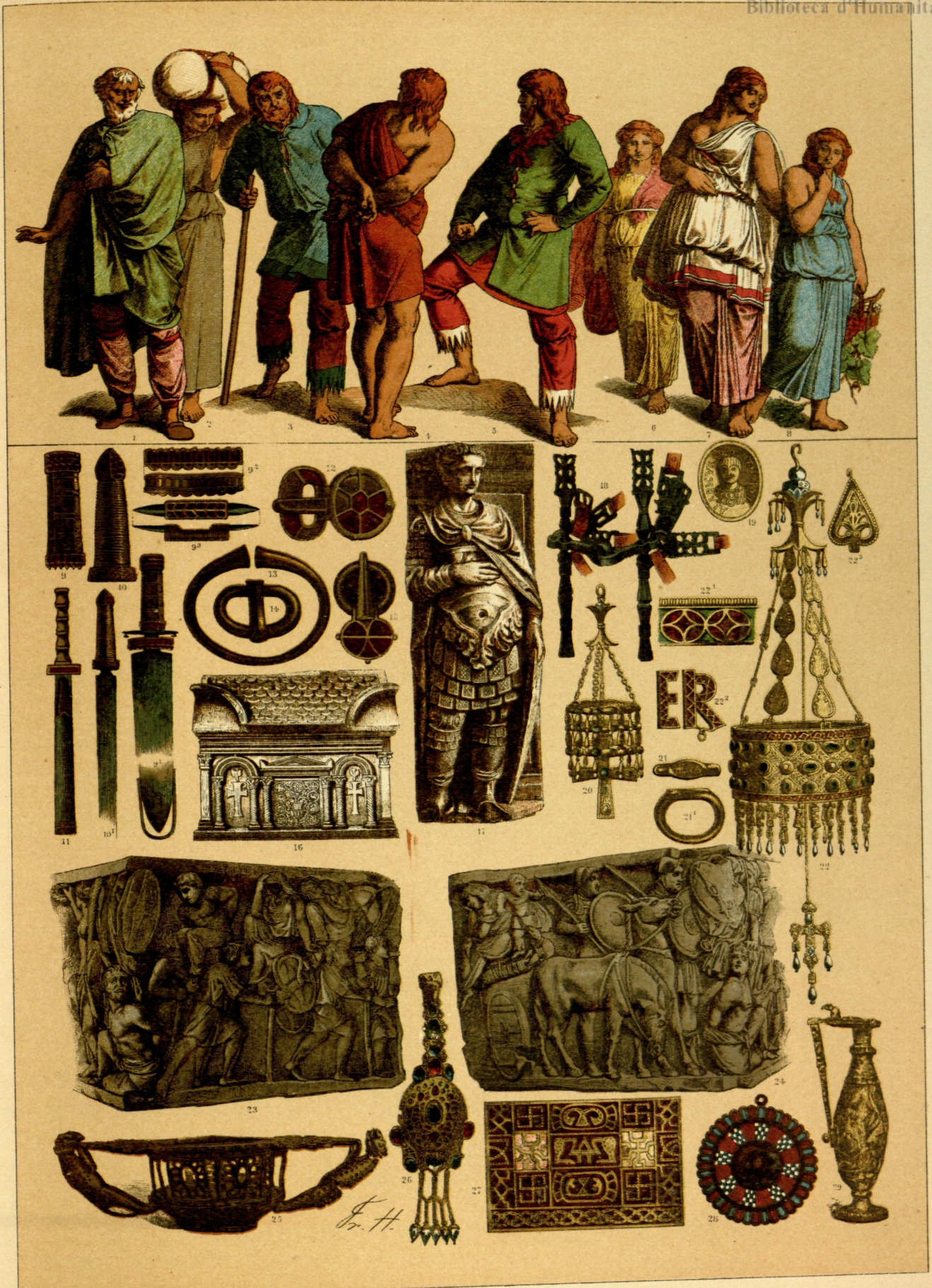
EDAD MEDIA. - TRAJES, ARMAS, ESCULTURAS, ADORNOS Y VASIJAS DE LOS GODOS