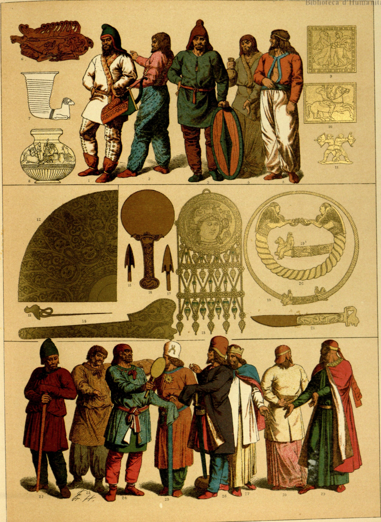
EDAD ANTIGUA. - TRAJES, ARMAS Y ADORNOS DE LOS ESCITAS Y PARTOS