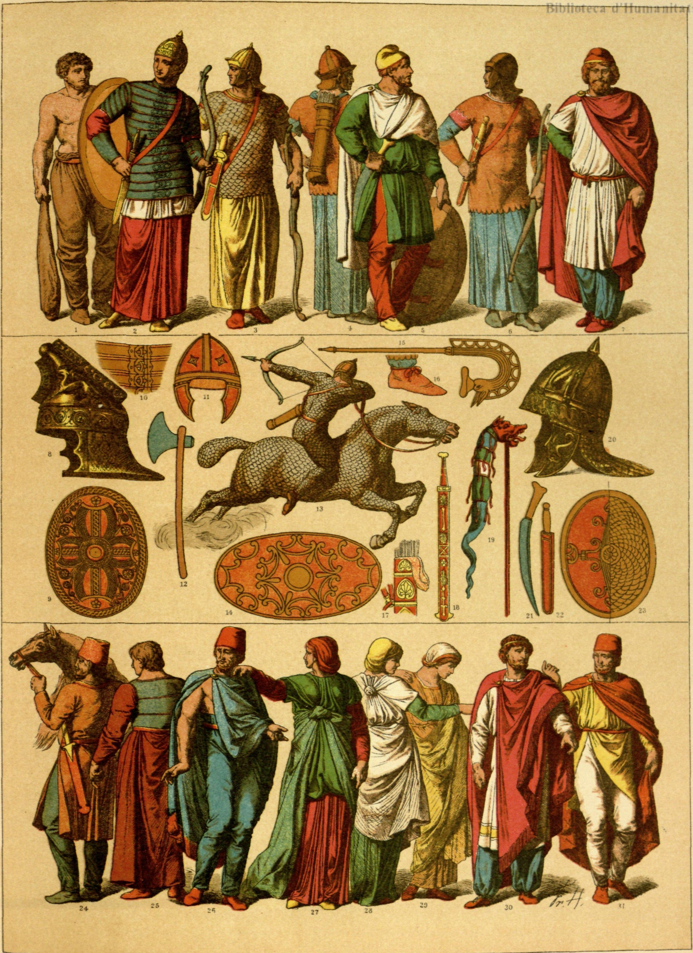
EDAD ANTIGUA. - TRAJES Y ARMAS DE LOS SÁRMATAS Y DACIOS