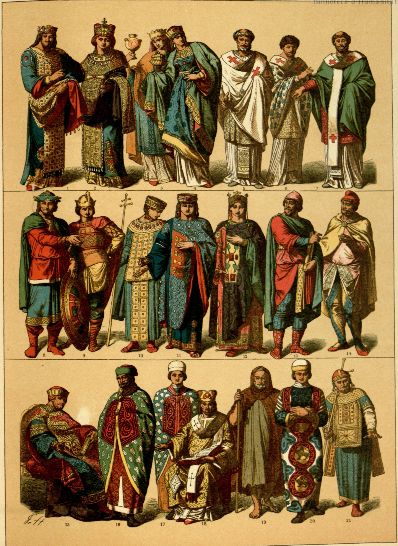
EDAD MEDIA. - TRAJES DE LOS BIZANTINOS DESDE EL AÑO 1000 AL 1200