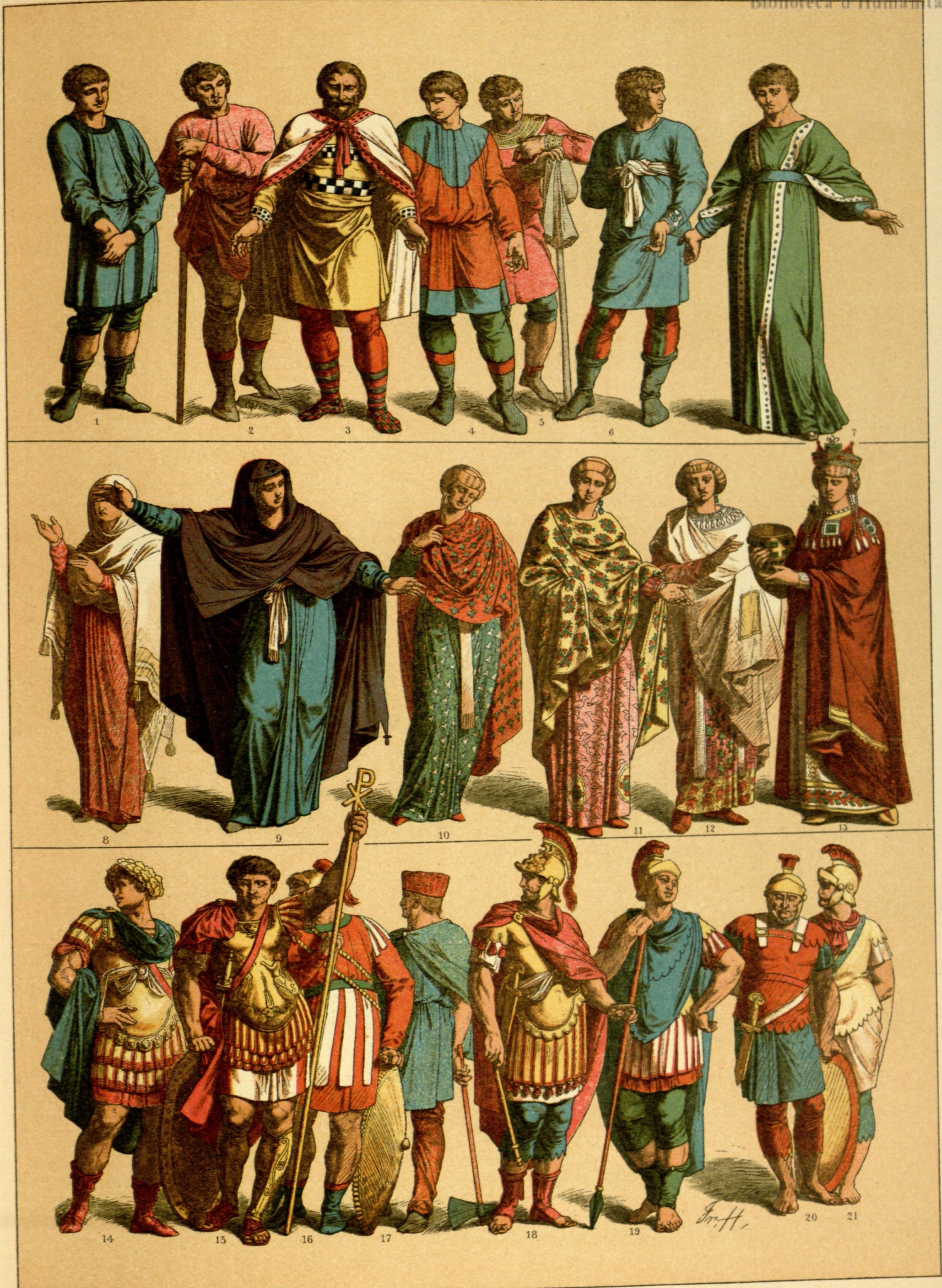
EDAD MEDIA.-TRAJES Y ARMAS DE LOS BIZANTINOS DESDE EL AÑO 400 AL 600