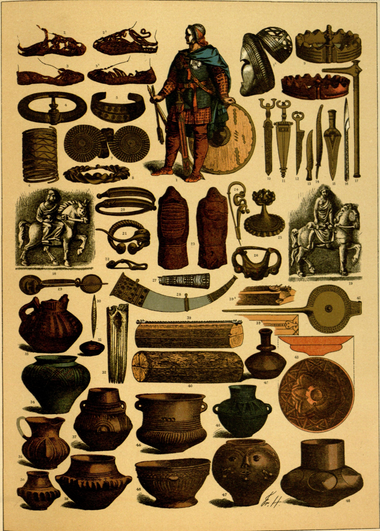
EDAD ANTIGUA.—CALZADO, ARMAS, ADORNOS, VASIJAS Y OTROS UTENSILIOS DE LOS GERMANOS