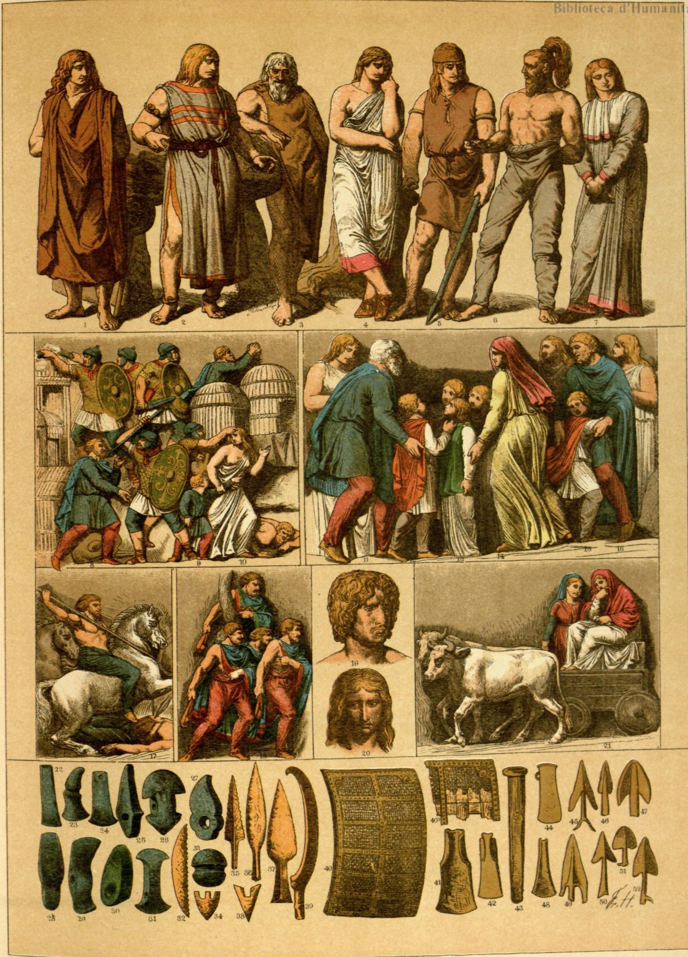
EDAD ANTIGUA.-TRAJES Y ARMAS DE LOS GERMANOS