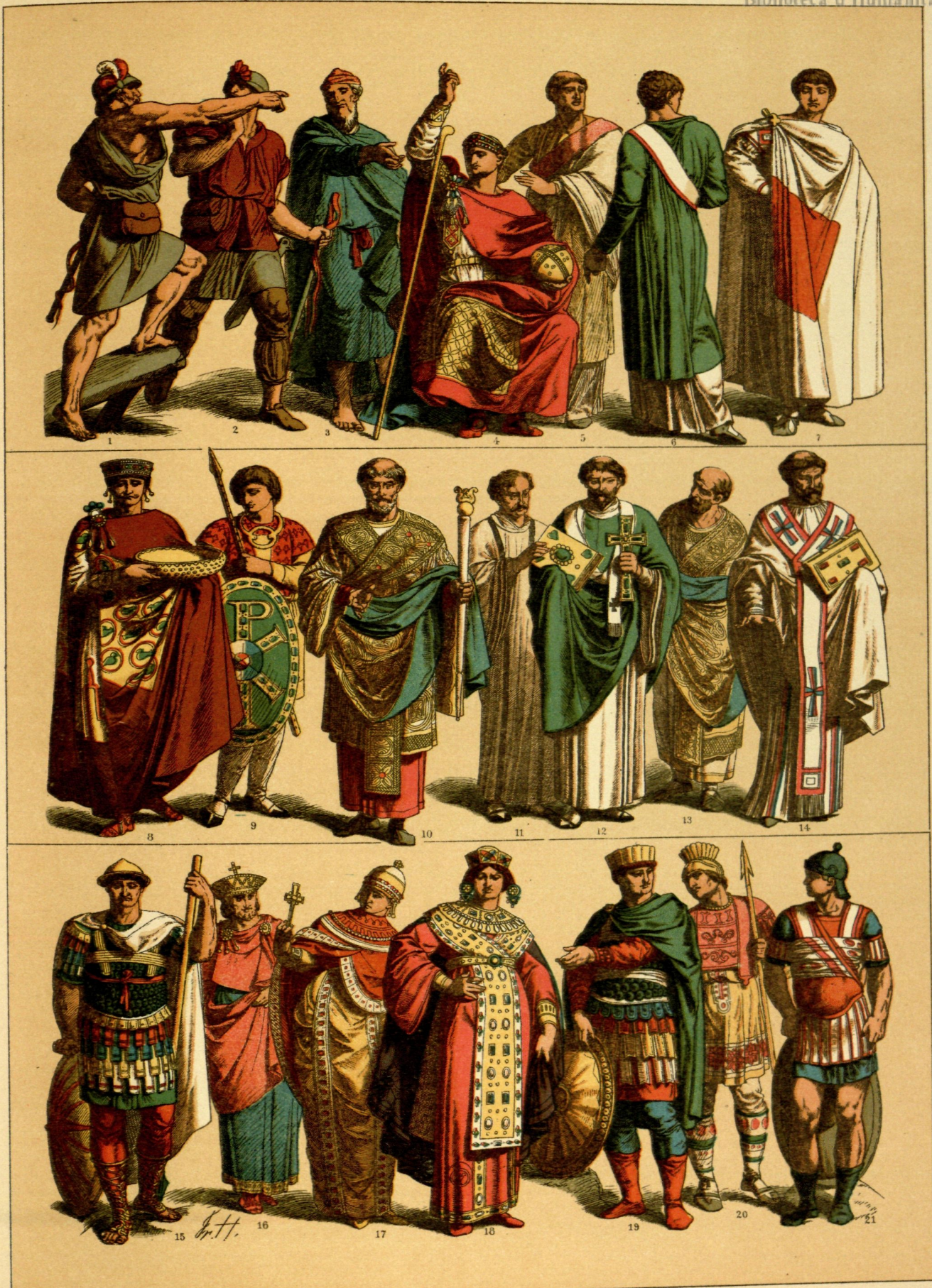
EDAD MEDIA.-TRAJES Y ARMAS DE LOS BIZANTINOS DESDE EL AÑO 400 AL 700