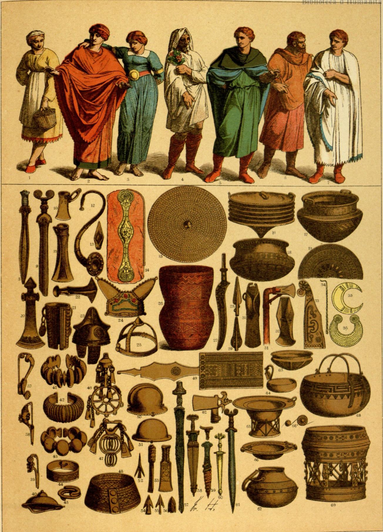
EDAD ANTIGUA.—TRAJES, ARMAS, VASIJAS Y ADORNOS DE LOS GALO-ROMANOS Y CELTAS