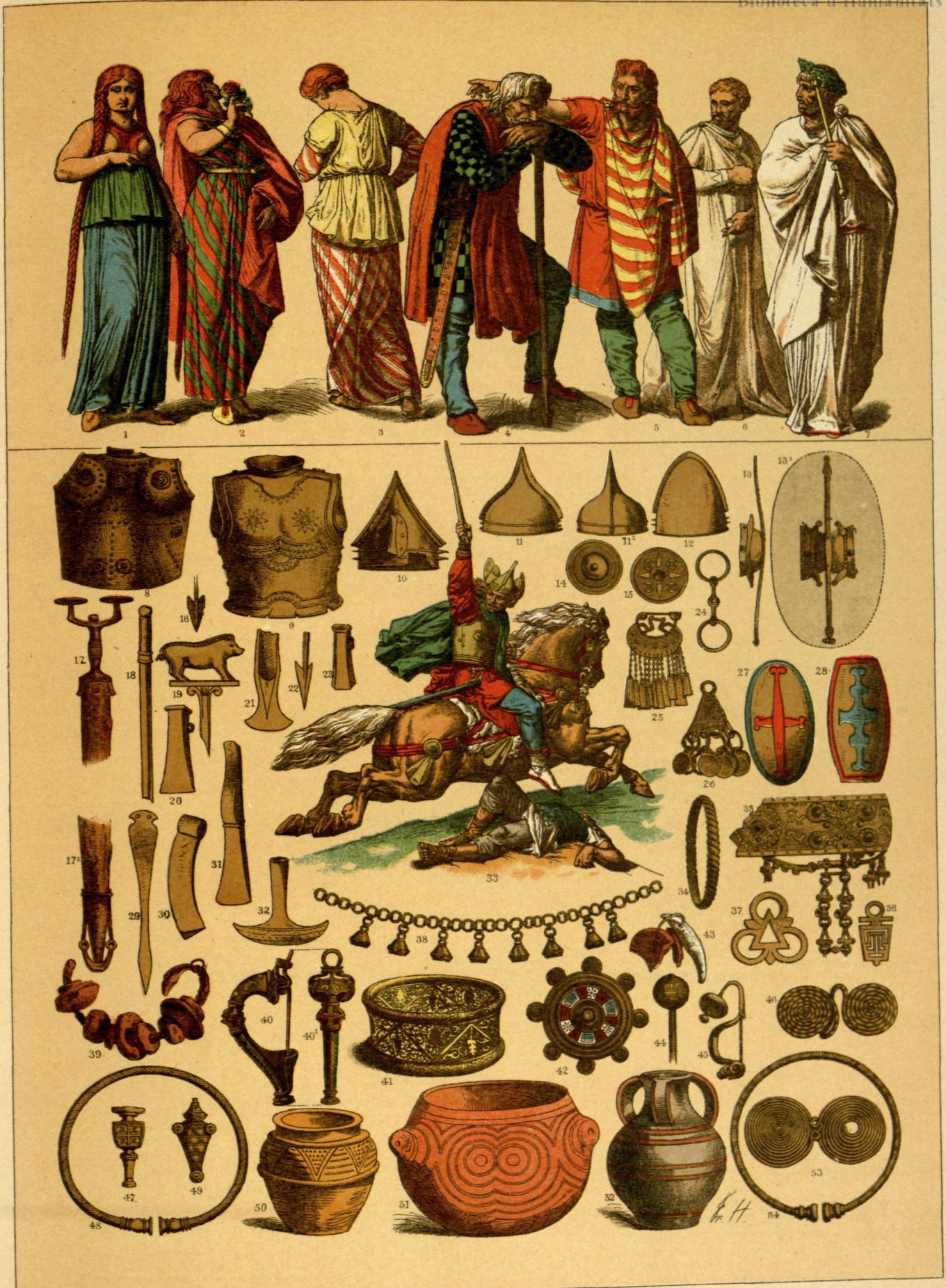
EDAD ANTIGUA. —TRAJES, ARMAS, ADORNOS Y VASIJAS DE LOS GALOS