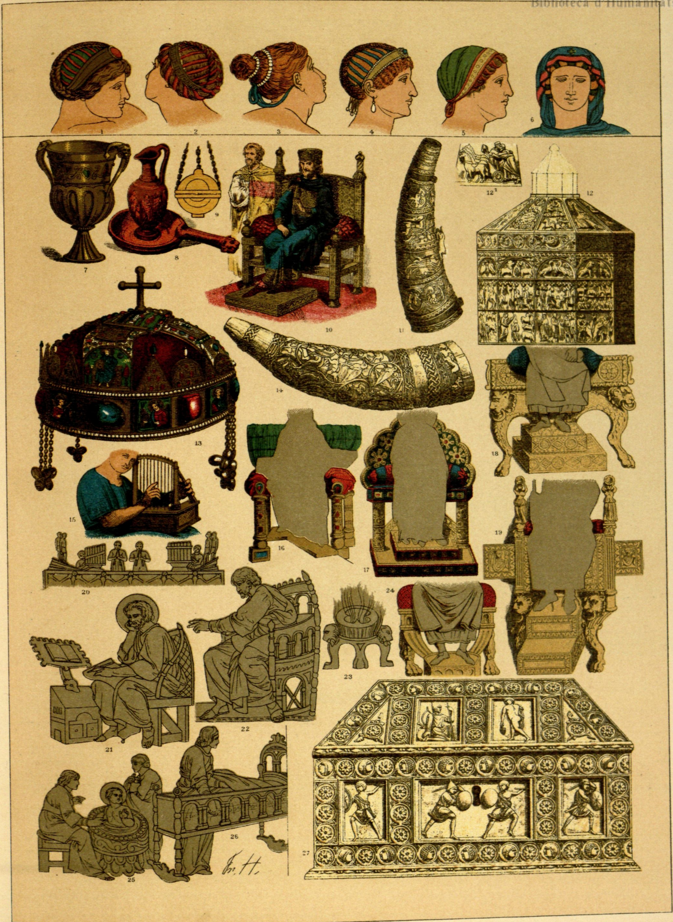
EDAD MEDIA.- TOCADOS, VASIJAS, OBJETOS DE ADORNO Y MUEBLES DE LOS BIZANTINOS