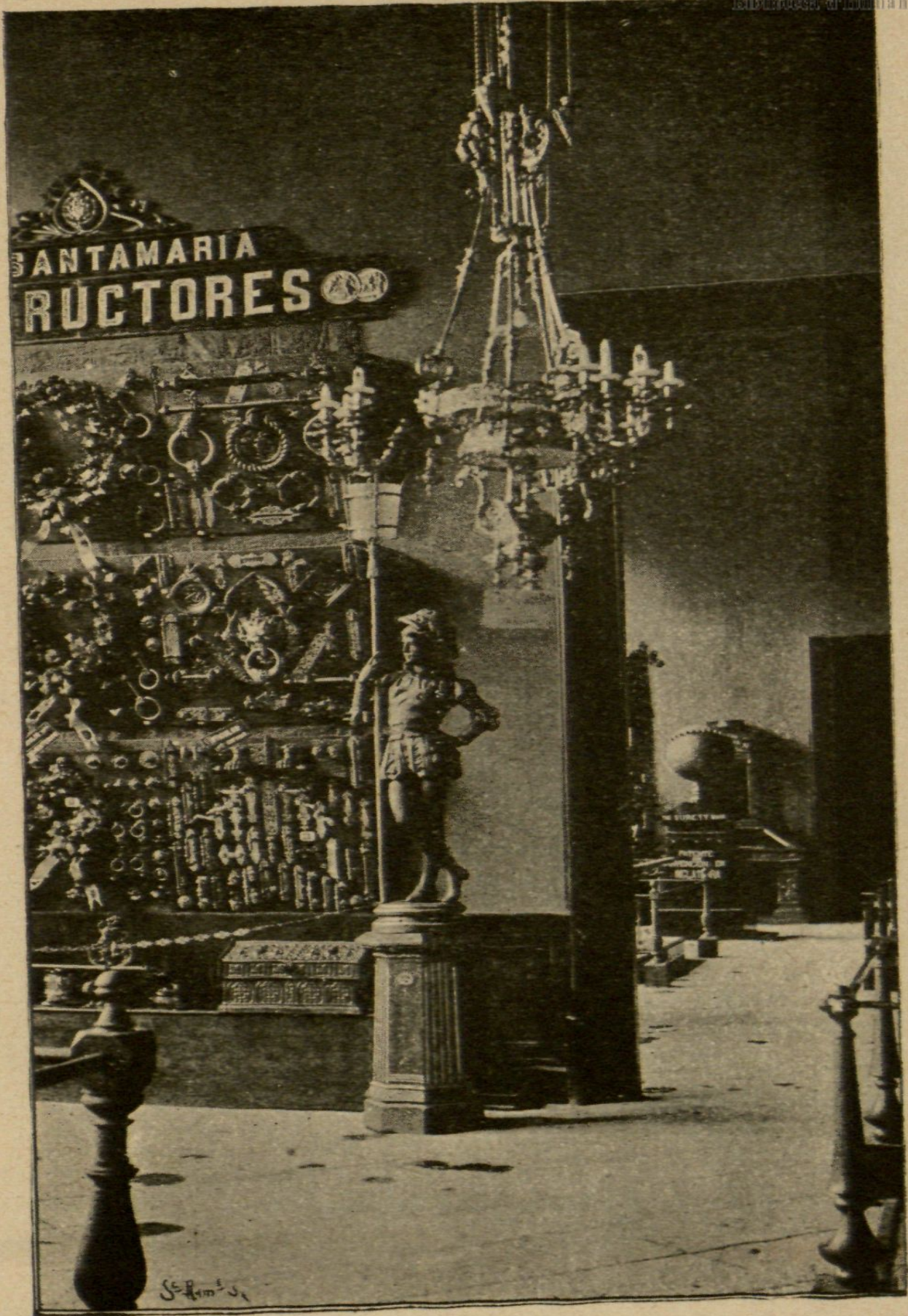
SECCIÓN DE METALISTERÍA.