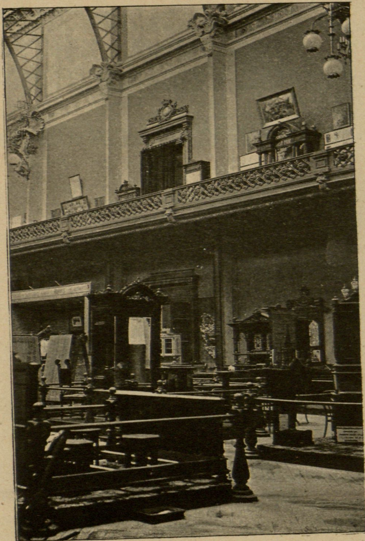
GRAN SALÓN CENTRAL. — MUEBLES Y GRABADO.