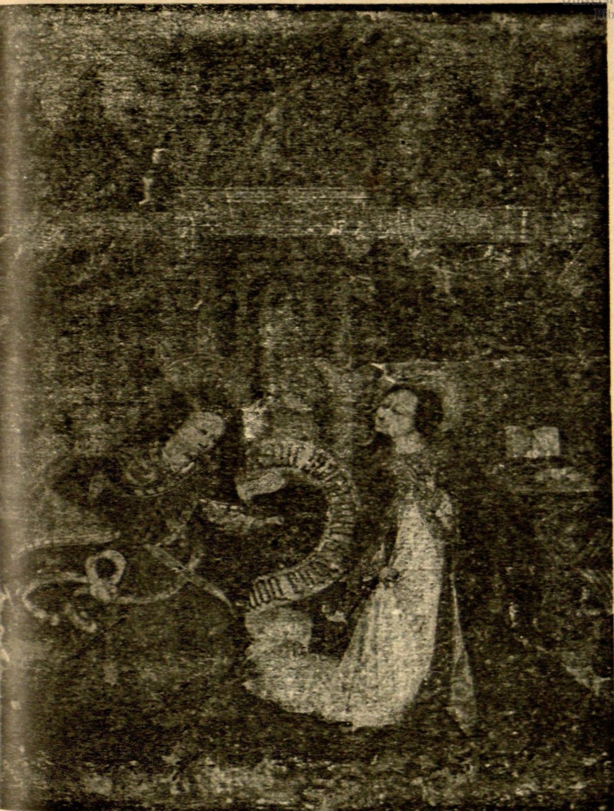
Núm 1773.—LA ANUNCIACION DE LA VÍRGEN