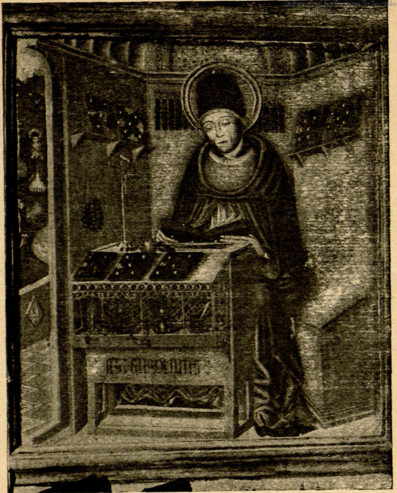
Num 625 —SAN AGUSTIN