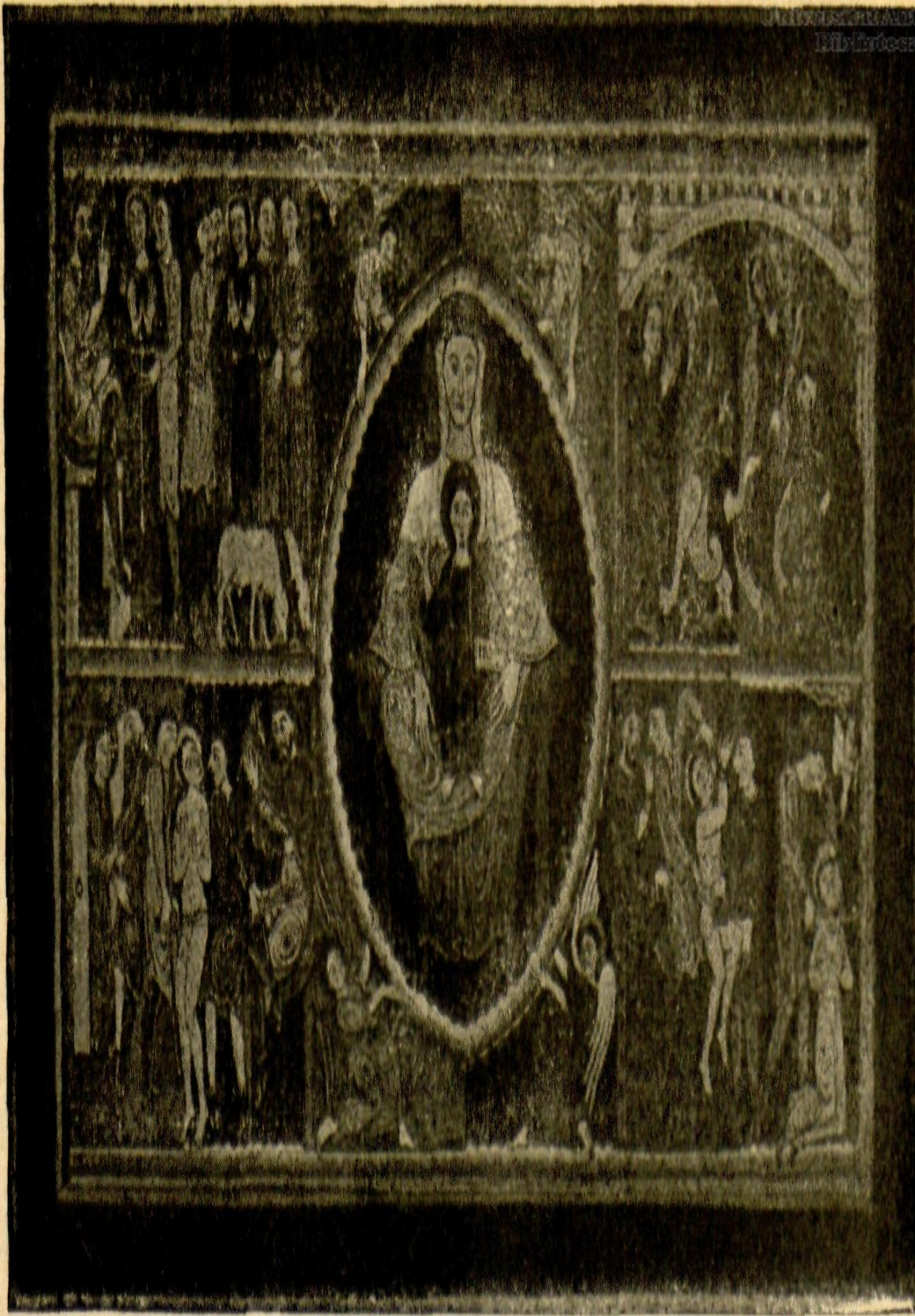
Núm. 5.—SANTA MARGARITA