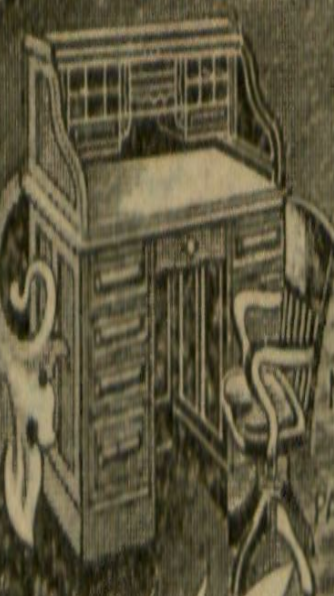
MUEBLES MODERNOS PARA OFICINAS