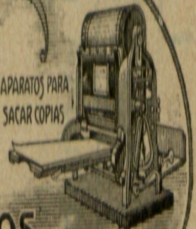
APARATOS PARA SACAR COPIAS