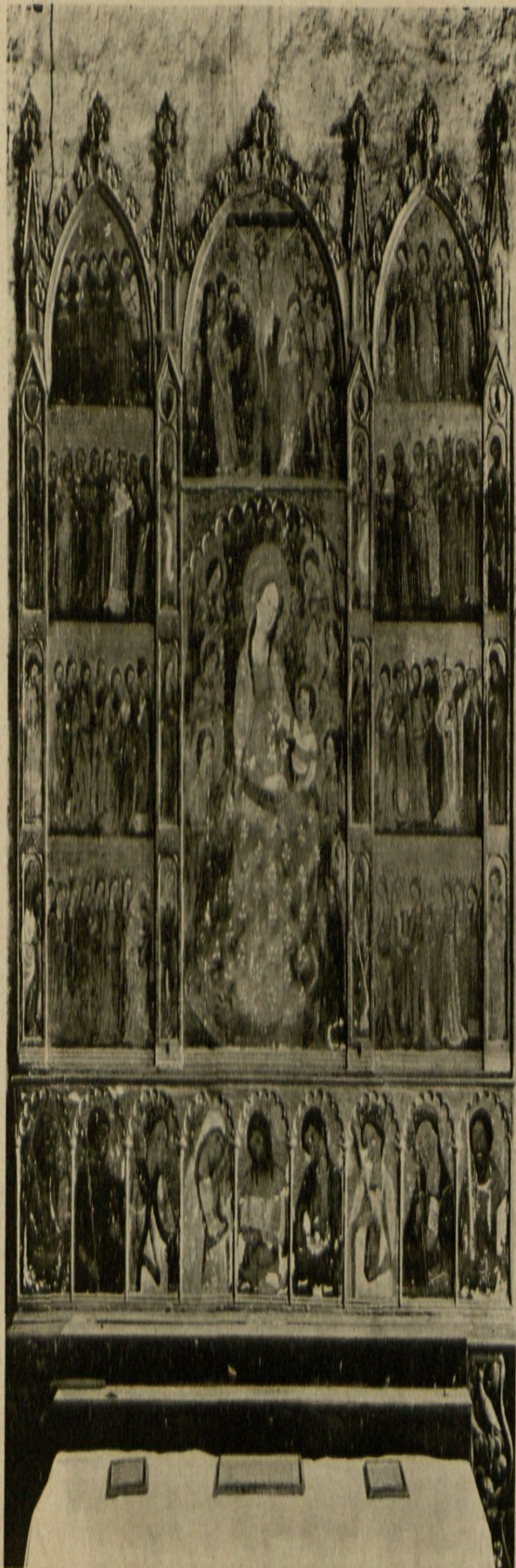
SAN CUGAT.—RETABLO DE TODOS LOS SANTOS.—1893