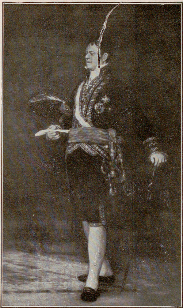
SALA XIII EL DUQUE DE SAN CARLOS por D. FRANCISCO GOYA