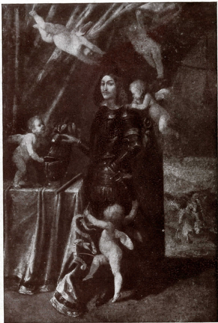
N.º 34. Escola flamenca: Van Dyck?