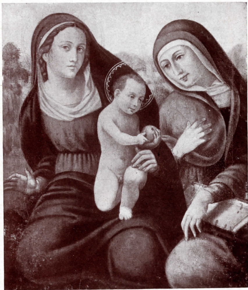
N.º 29. Atribuit a Andrea Solari (taula)