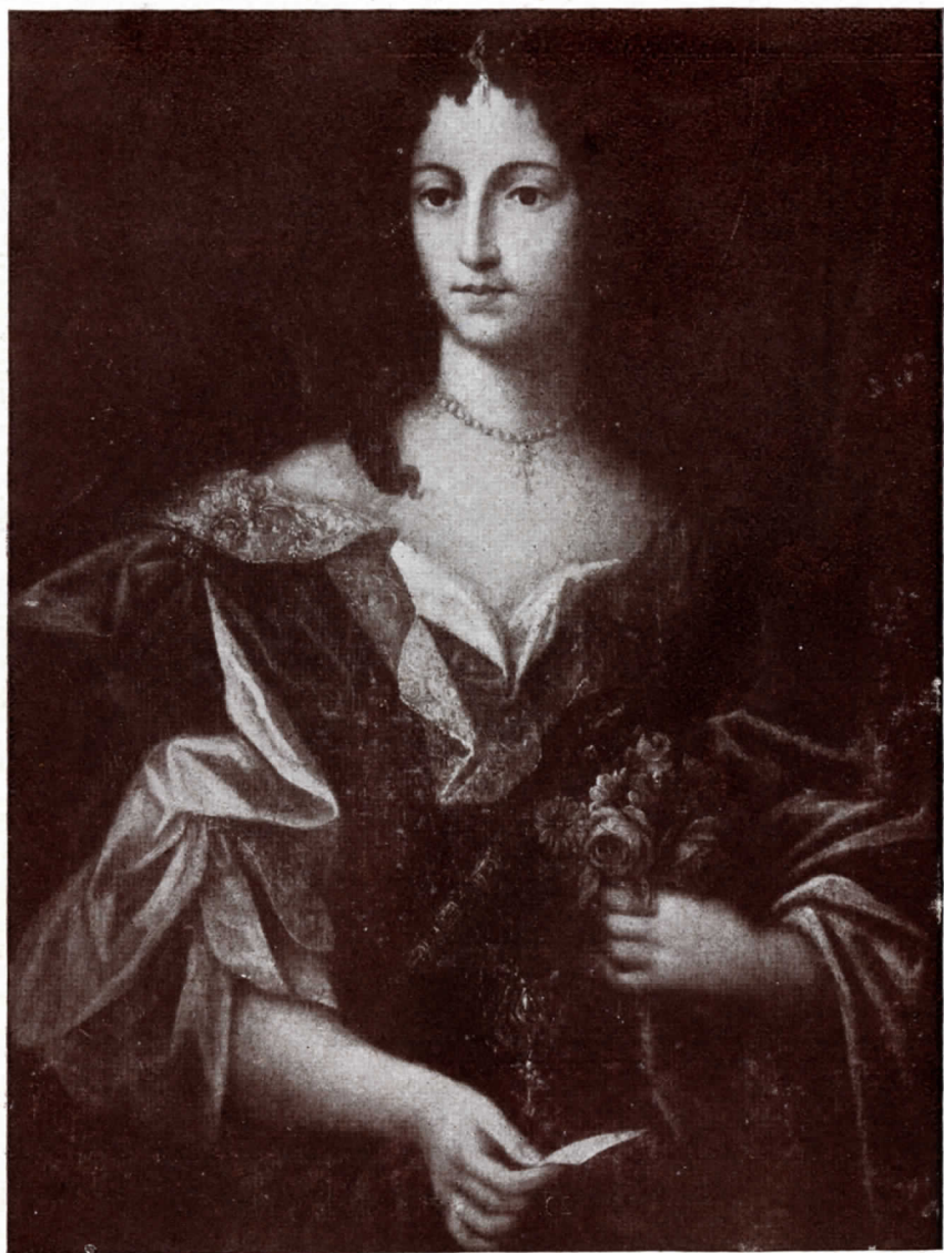
N.º 25. Atribuit a Vestier