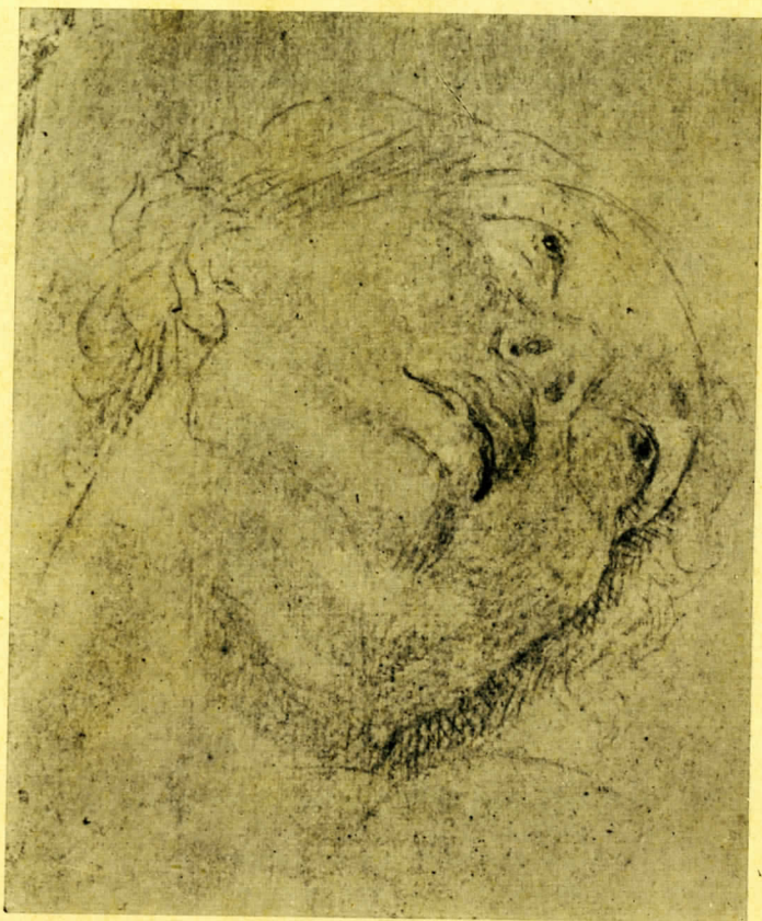
ANTONIO RAFAEL MENGS - Cabeza de estudio