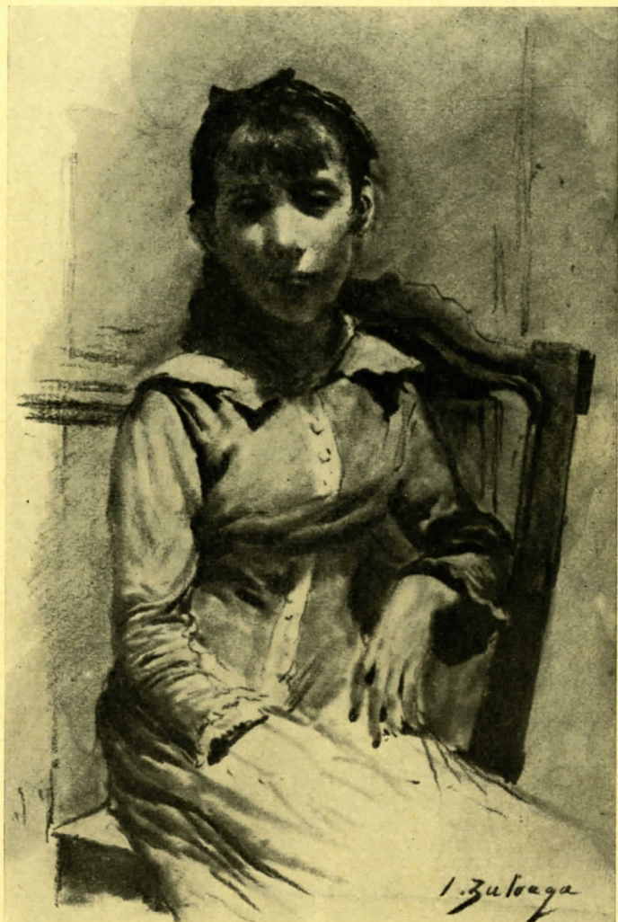
IGNACIO ZULOAGA - Retrato de niña