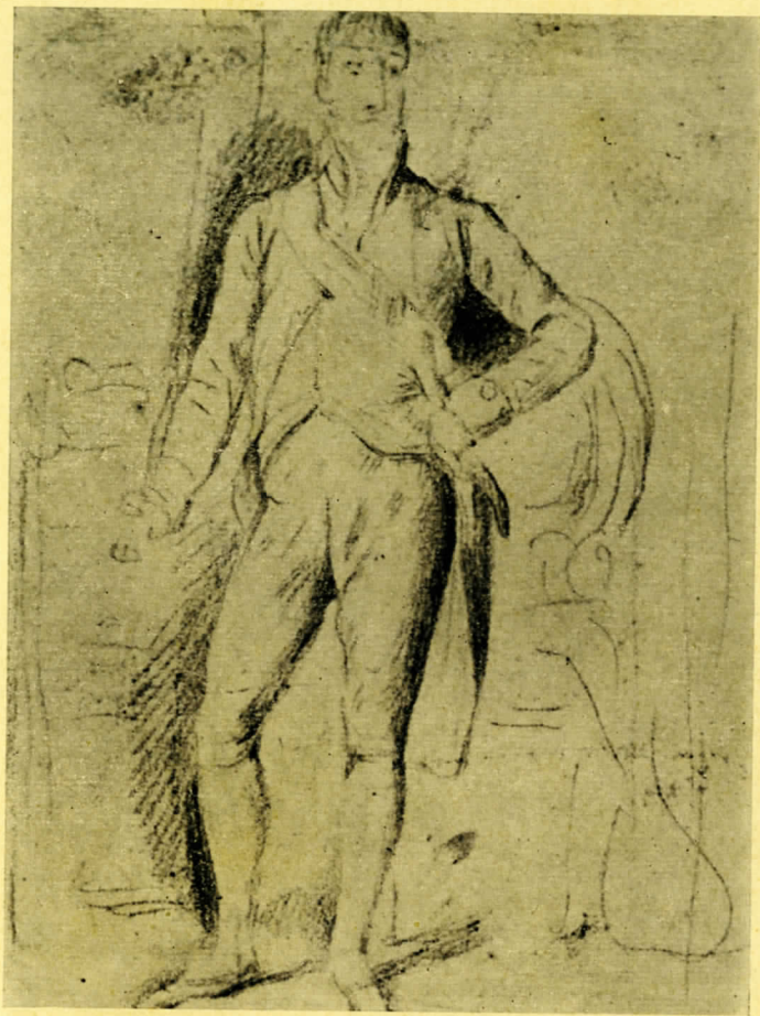
ANTONIO CARNICERO - Boceto para un retrato de Fernando VII