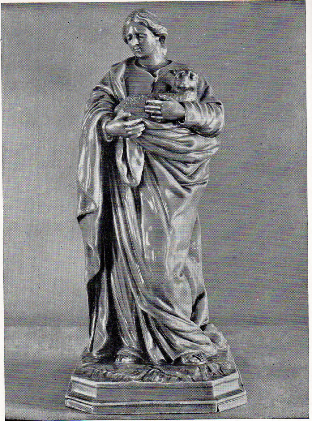
144. — Santa Inés. Figura de porcelana de Alcora. Museo de Artes Decorativas, Barcelona.