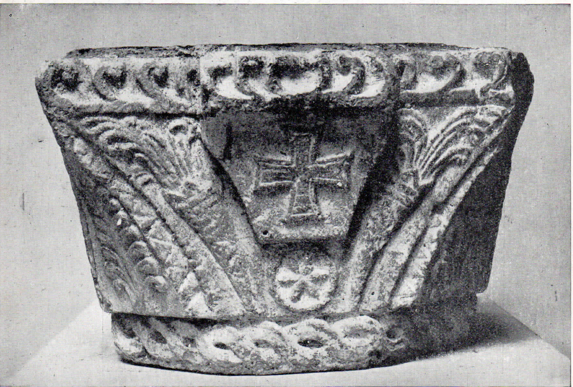
109 y 110. — Capiteles de estilo Hispano-Visigodo. Museo Arqueológico, Barcelona.