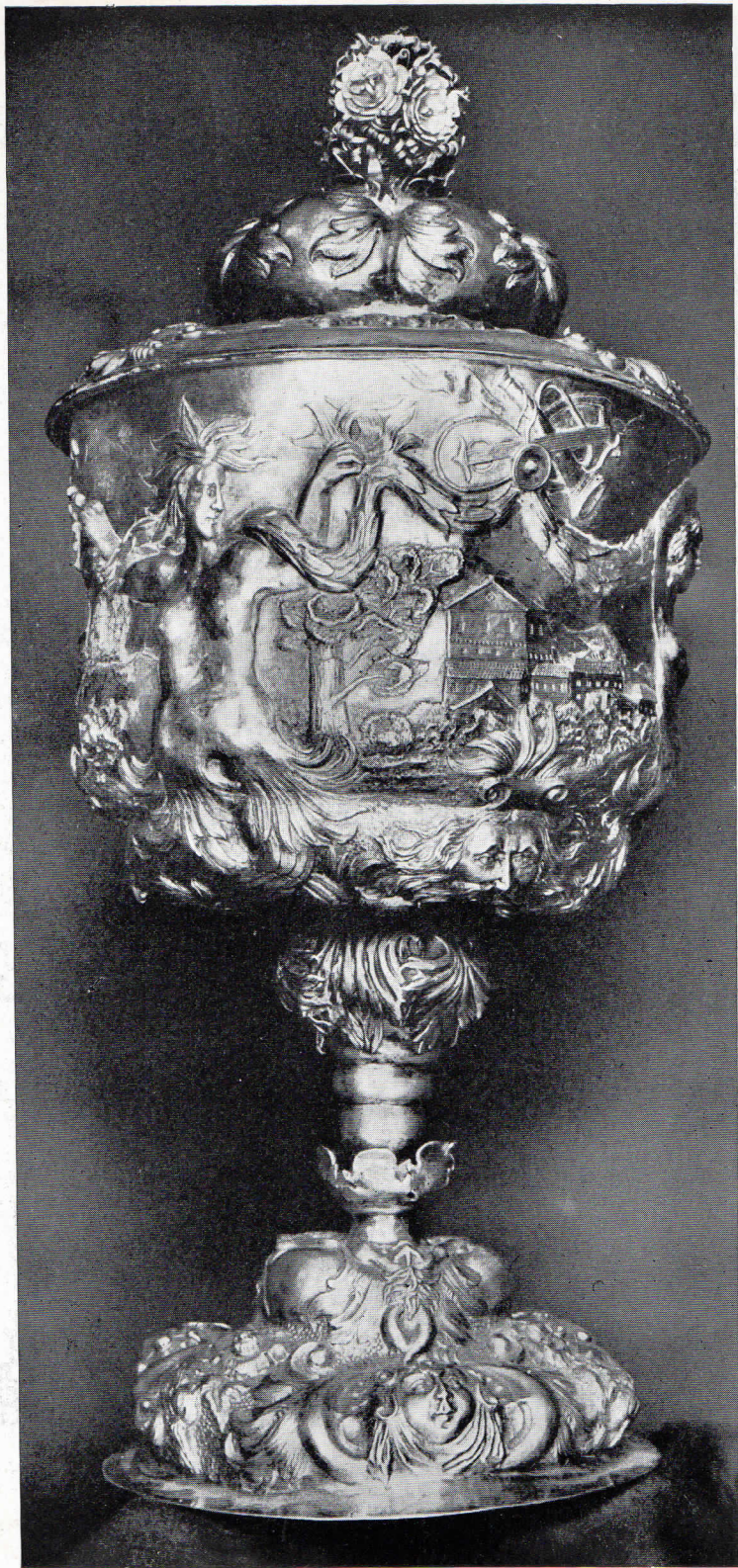
130. — Copa de bodas. Obra austríaca, en plata. Museo del Vino. Vilafranca del Panadés.