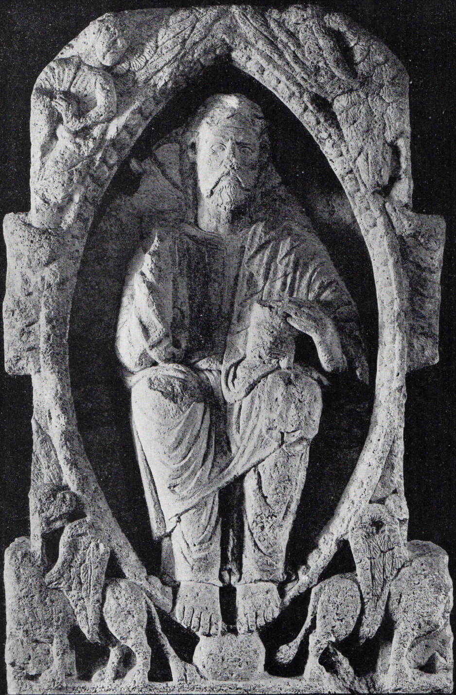
111. — Pantocrator. Relieve románico en piedra. Museo Marés, Barcelona.