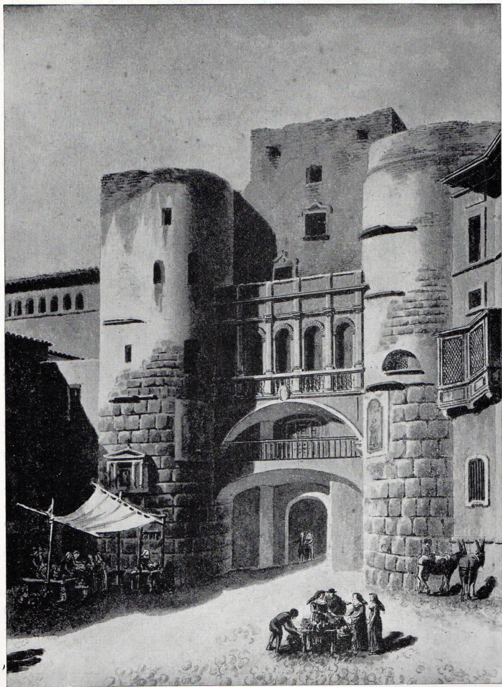
146. — La Plaza Nueva hacia 1800. Dibujo. Archivo Histórico de la Ciudad, Barcelona.