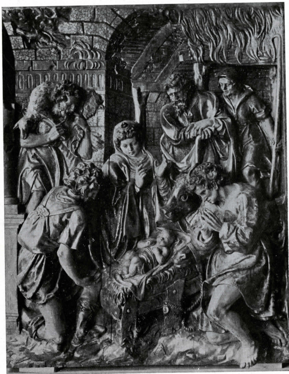
AGUSTI PUJOL. Retablo del Rosario-fragmento. -Iglesia Parroquial de Sarriá.