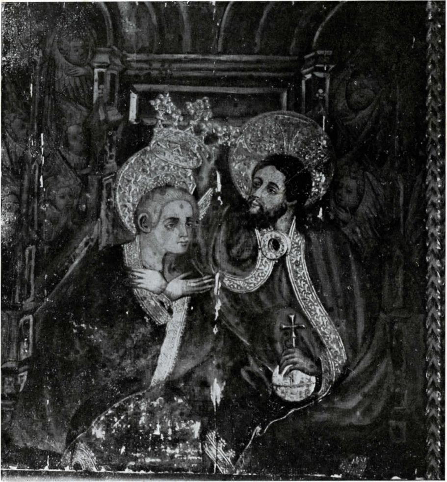
JOAN MATES. Coronación de la Virgen, del retablo de Vilarrodona. destruido en 1936.