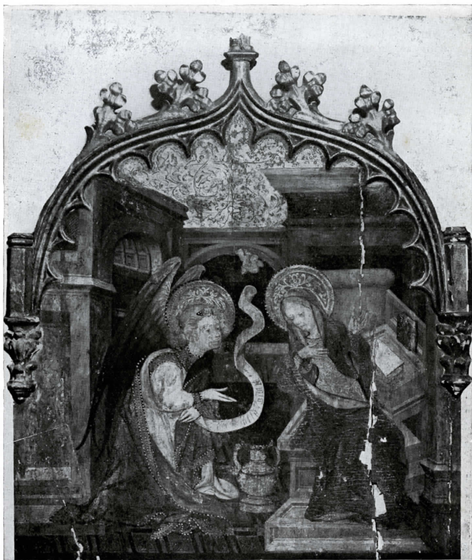
JOAN MATES. Anunciación: fragmento de retablo · col. Brimo, París.