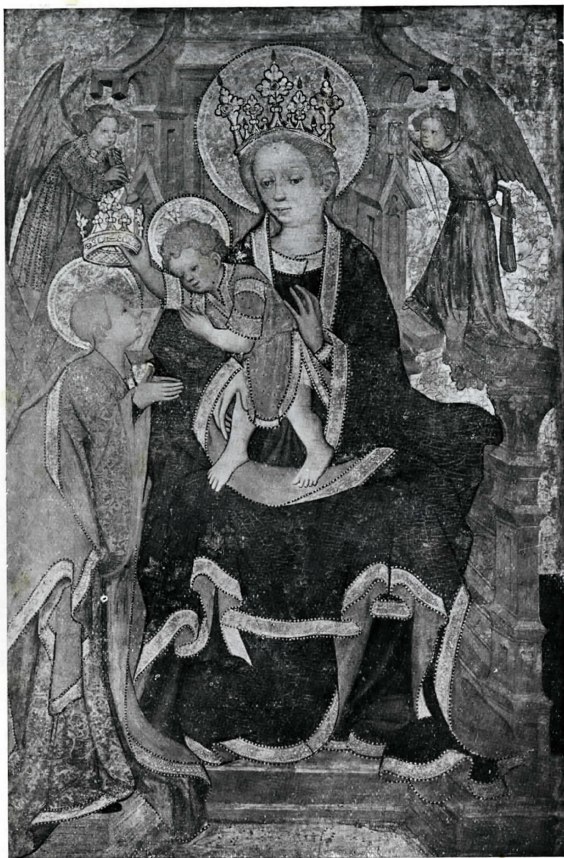
JOAN MATES. Retablo, la Virgen y el Niño coronando a Sta. Eulalia. - Museo del Seminario, Venecia.