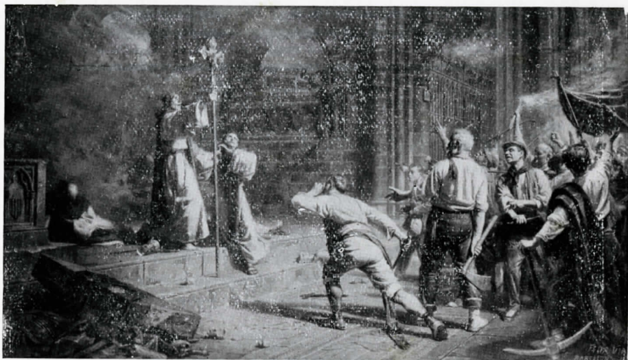
FELIX VIA PAGES. «L'allau», pintura de grandes proporciones que antes de 1936 figuró en el Museo de Arte de Barcelona.