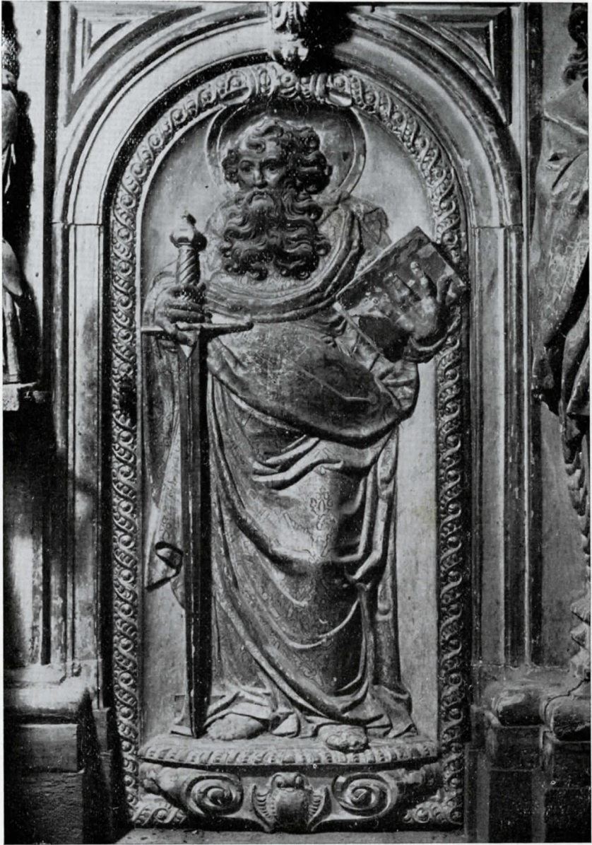
JOSEP TRAMULLES. San Pablo. -Altar Mayor de Santes Creus.