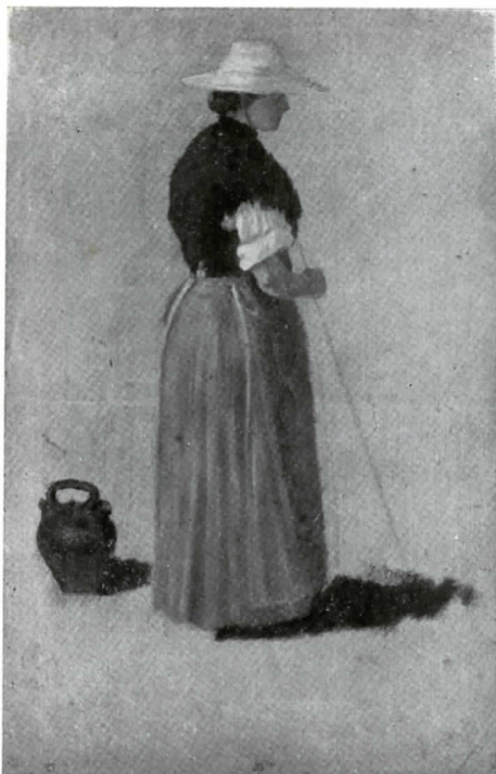
LLUIS RAFOLS Apunte para un cuadro de costumbres — Col A. Rafols