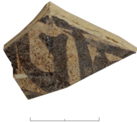
Figura 2. NºInv 24.7. Fragmento de cerámica islámica pintada al manganeso (ss. IX - X dC).