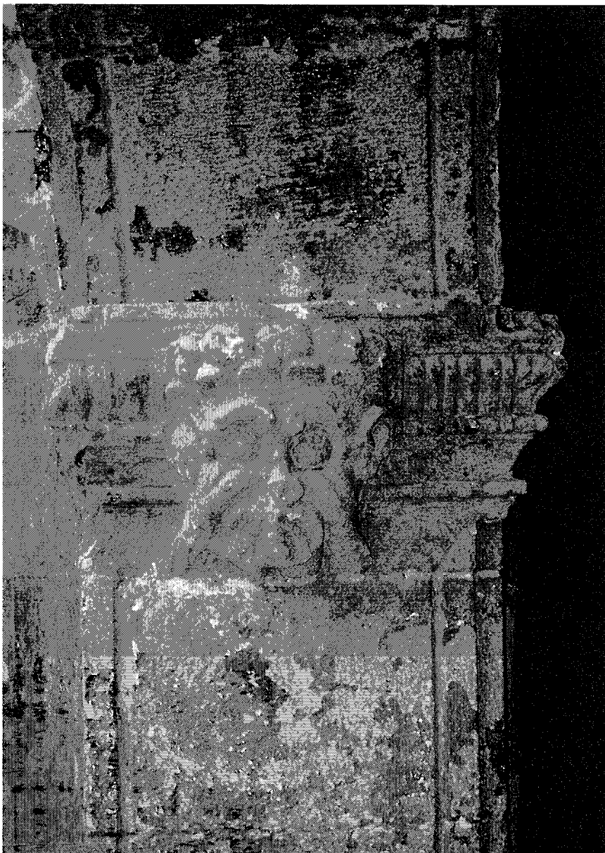
Figura 7. Sant Agustí Vell de Barcelona: capitell siscentista amb mascaró.