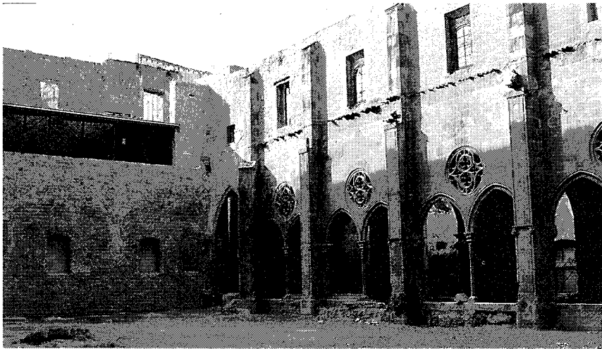
Figura 3. Sant Agustí Vell de Barcelona: arcades del claustre gòtic i restes del refectori.