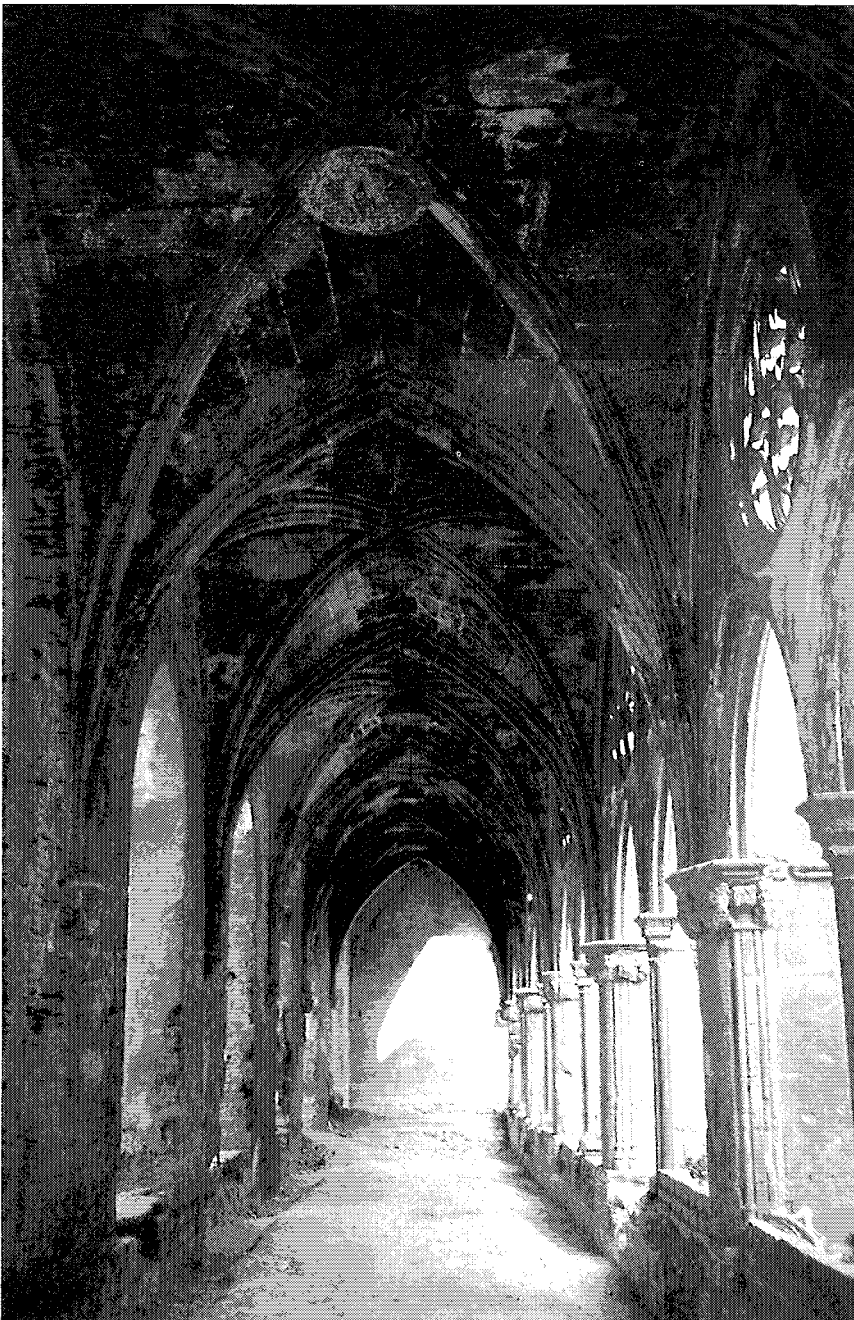
Figura 4. Sant Agustí Vell de Barcelona: ala occidental del claustre gòtic.