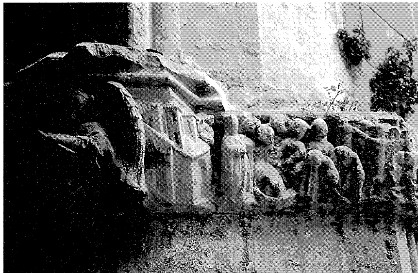
Figura 5. Sant Agustí Vell de Barcelona: imposta amb històries de sant Agustí.