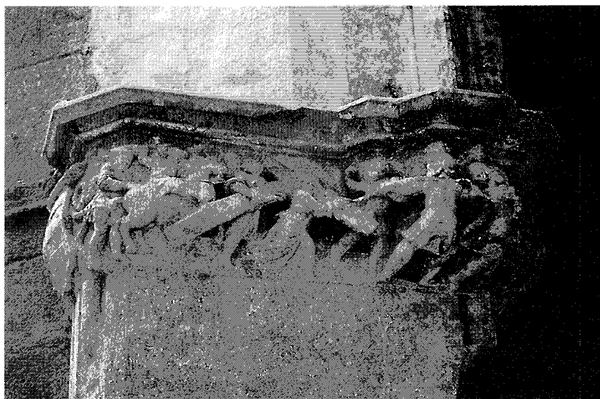
Figura 6. Sant Agustí Vell de Barcelona: imposta cincinentista amb escena de la passió.