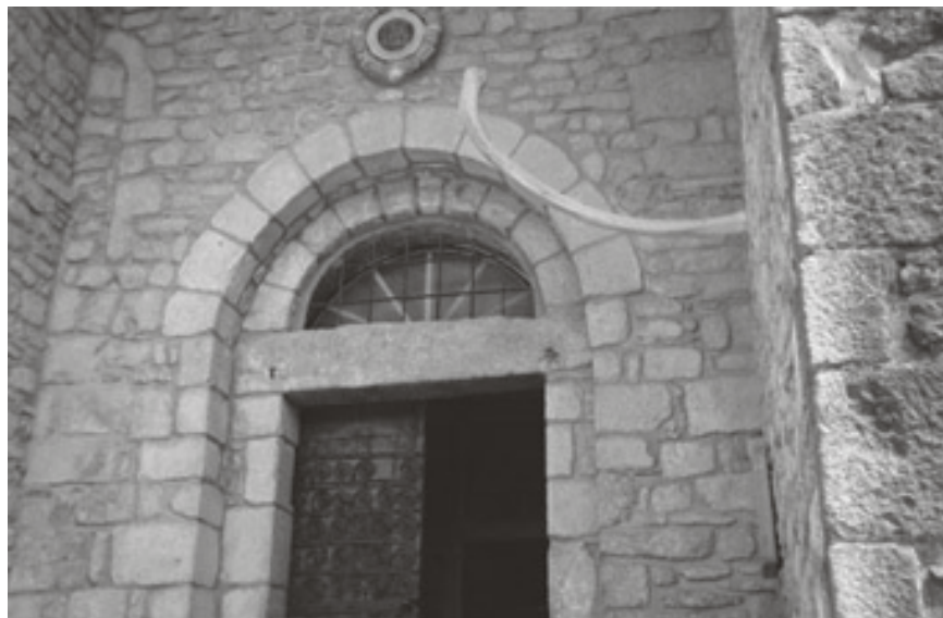
Figura 2. Balena. Prats de Molló (Nani Hidalgo).

Per poca zoologia que se sàpiga, salta a la vista que cocodrils i balenes són animals estranys en aquests paisatges. L'hàbitat del caiman és ben llunyà de Madrid, on n'hi ha un a la parròquia de San Ginés. De balenes, certament n'hi ha alguna per aquests mars, però Prats de Molló o Sant Martí Sarroca, que en guarden costelles en els frontals de les seves esglésies, estan en uns paratges prou distants de platges i mariners. Parlant de lleons, Pere el Cerimoniós deia que eren «bèsties assats rares