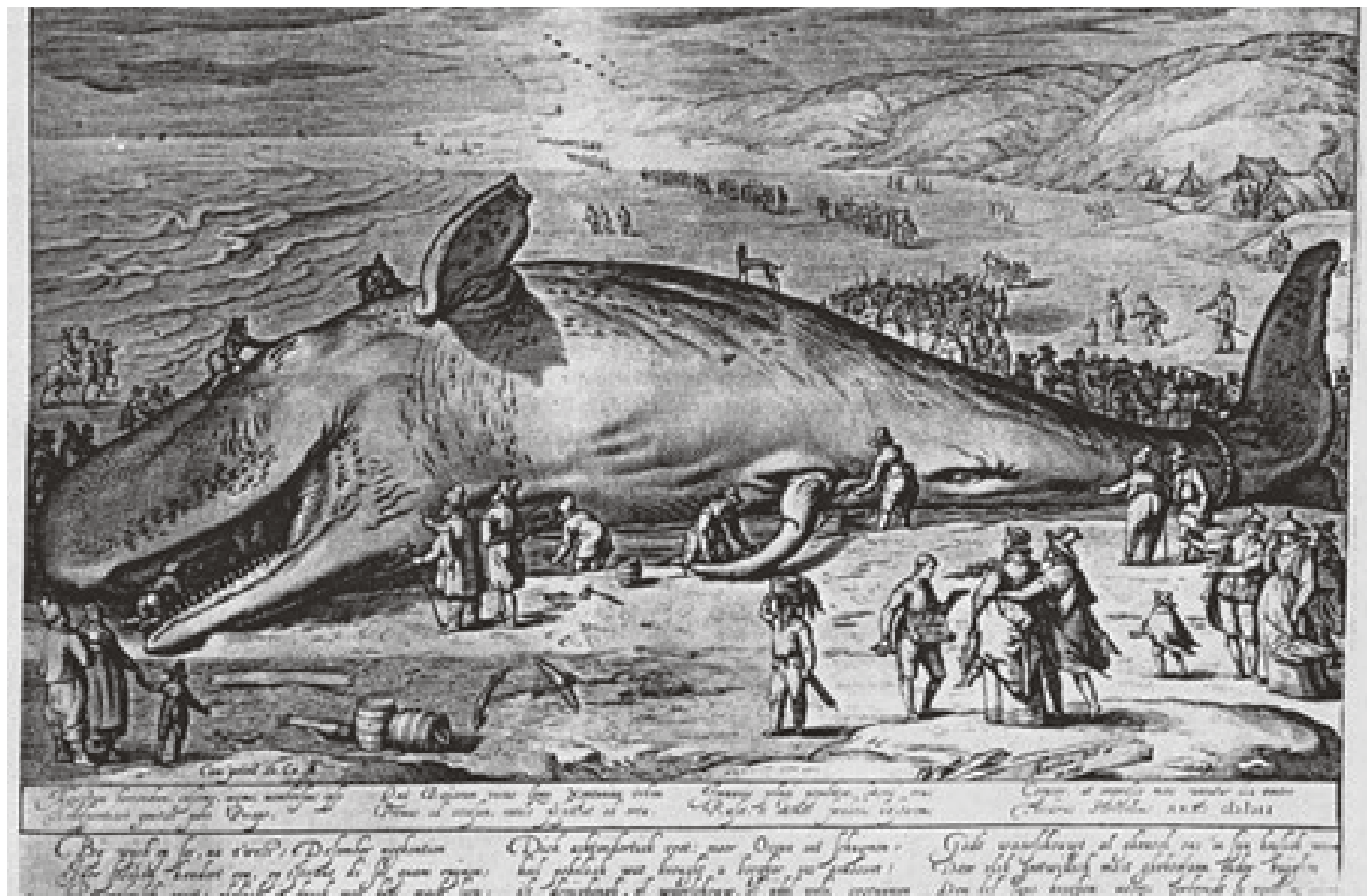
Figura 3. Jacob Matham: Balena avarada a les costes d'Holanda el 1598.

en esta terra». Per això li agradava tenir-ne molts, perquè eren estranys i insòlits. Aquella era la història d'una fascinació que ja vaig explicar anys enrere. Aquesta pot semblar ben igual: una altra història apuntalada sobre el rar i l'insòlit. No deuria ser cap sorpresa, perquè, de fet, hom només escriu sobre el mateix, sempre, perquè escriu a partir de les mateixes preguntes i fascinacions. L'únic que canvia són els plantejaments, no endebades els anys passen i els interessos canvien. De nou, doncs, una altra història d'animals. Ara, només els veurem morts. L'ossamenta blanca, neta i descomunal de les balenes, i la bèstia rugosa, amb la bocassa immobilitzada des de fa segles. A punt per començar, doncs, una nova història, estranya, plena d'animals, sorprenent, insòlita, com sempre.