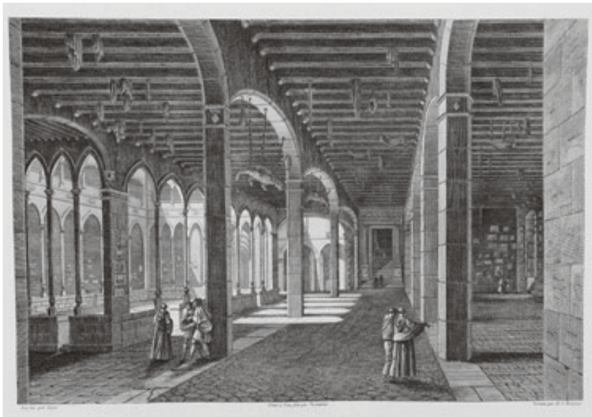
Figura 8. A. de Laborde: Claustres de Montserrat.

moment del llop. Un llop devorador de criatures, un cop ha estat caçat, no he vist mai que se'l pengés a l'església. I mira que el llop, a ple dret simbòlic, hauria de ser dels primers a entrar al temple, mort, vençut. Formaria part de la iconografia del mal abatut, als peus de sants i santes. Des del moment en què Crist és el Bon Pastor, i els fidels, les ovelles, indubtablement el llop és l'enemic, l'encarnació del mal. El llop mort servia per altres coses que no pas decorar esglésies. Cert, també se l'espellava, però amb la pell es feia la capta. Els caçadors anaven de casa en casa, mostrant la pell, demanant i recollint el que la gent els donava, agraïda per haver-los lliurat de la mala bèstia. A vegades, la pell del llop mort era penjada a les tanques i portes dels corrals, en la creença que els vius no s'hi apropiarien.