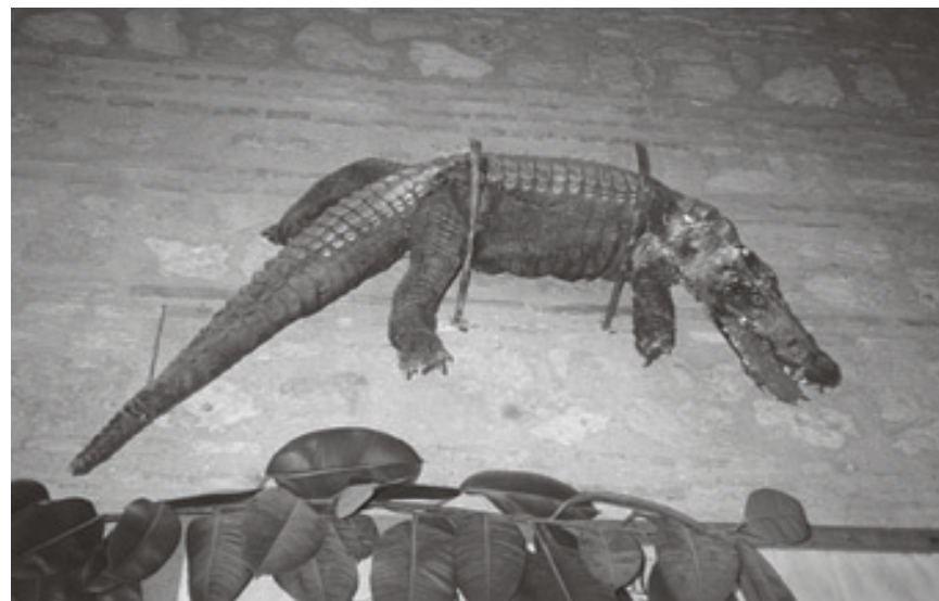
Figura 5. Caiman. Santuari de la Fuensanta (Marta Selva).

monestir de Guadalupe, anotà que hi havia la pell d'un cocodril, portat de Guinea. Més enrere en el temps, el 1260, hi ha l'exemple de Sevilla. També és africà, ara d'Egipte. Tanmateix, aquests són casos excepcionals; la norma general és que d'ençà la descoberta i conquesta de les Índies, la procedència més habitual de les peces serà americana. Segons es conta a les històries de l'església de San Ginés, de Madrid, el caiman que hi ha sota l'altar de la Verge del Remei prové de Portobello, al Panamà caribeny. Els dos de València foren tramesos pel virrei del Perú el 1606. També són americans i del segle XVII el de Sonsoles i de la Fuensanta de Còrdova. El de Berlanga de Duero fou portat el 1541 per fra Tomàs, fill de la vila, dominic, bisbe de Panamà, descobridor de les illes Galápagos i, diuen, introductor del tomàquet a Espanya.