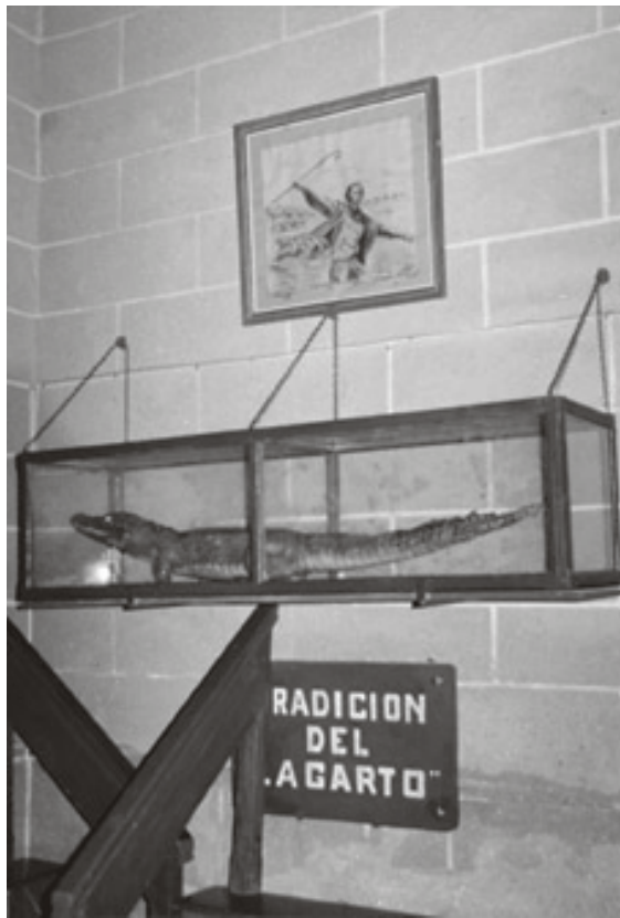
Figura 6. Caiman. Calzadilla.