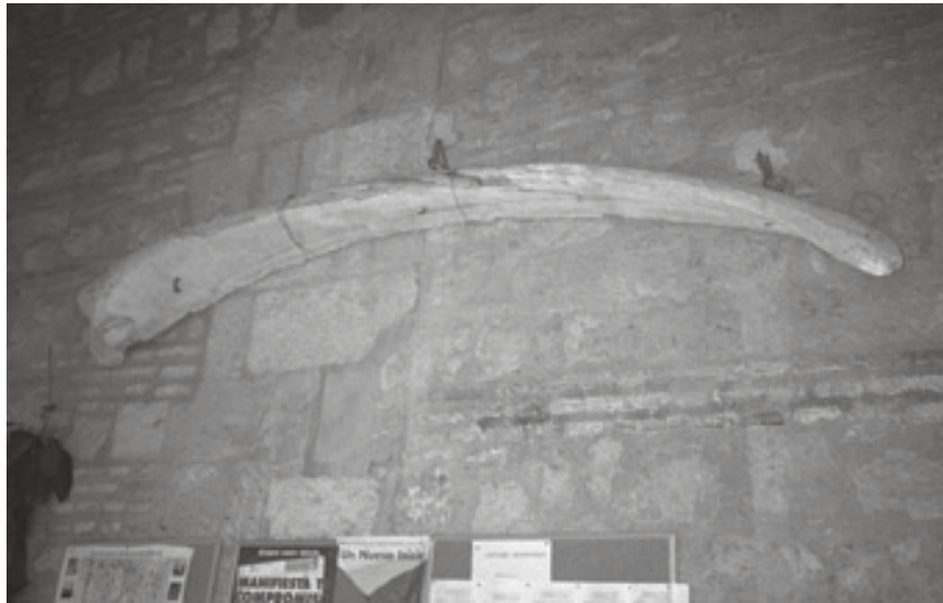
Figura 4. Balena. Santuari de la Fuensanta (Marta Selva).

de haberles quitado la grasa y azeite, tubieron el cuidado de enterrarlos en la arena». En algun moment de la neteja i sepultura algú es deuria fer amb un os: una vèrtebra, una costella; també pot ser que, al cap del temps, amb les llevantades i els cops de vent, la carcanada quedés desenterrada. Una rastellera d'ossos escampats per la sorra, polits per l'escuma, blanquejats pel sol i la sal, netejats pels carryners. Tot a punt per entrar en sagrat.