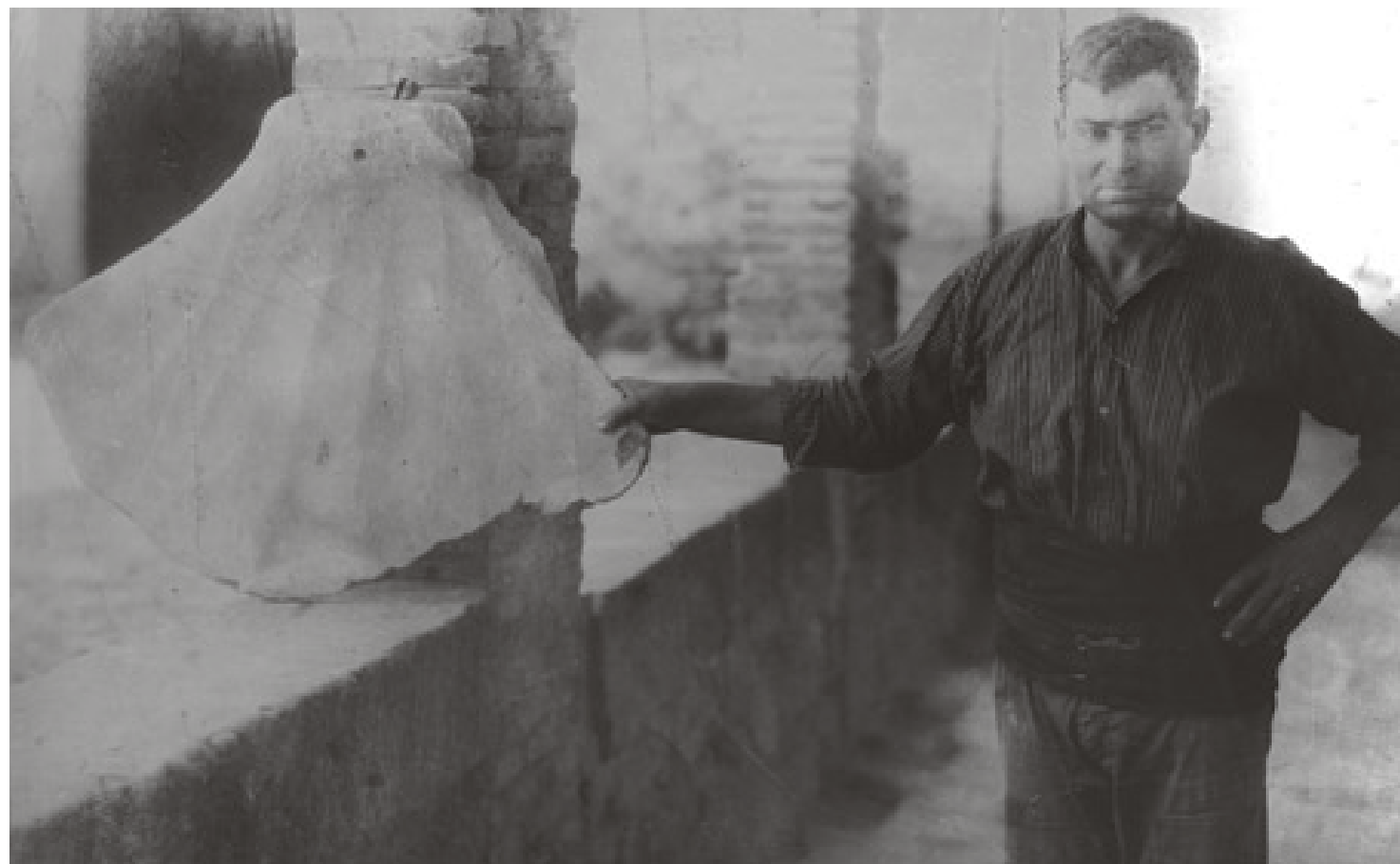
Figura 1. Balena. Santuari de Paretdelgada (Pere Català i Pic, circa 1925).

Potser és un problema meu, de xafarderia i d'ignorància, però m'agrada investigar sobre allò que trobo sorprenent i no sé, que m'intriga i no veig clar. Vaig preguntar i fer algunes consultes; tot fou molt pobre. Com és que altra gent no ho ha estudiat? Deu ser que han vist de tot, estan de tornada i troben d'allò més normal entrar en una església i topar-se amb la gola d'un rèptil al costat de la pica d'aigua beneïta. Les respostes foren minses i descoratjadores. Hi ha els que et diuen que sí, és ben estrany això dels cocodrils i les balenes, però no cal que hi perdís el temps, són anècdotes. No sé si un cocodrill és una anècdota; tampoc sé si molts cocodrils són moltes anècdotes o una de sola. El que sí que sé és que ja havia sentit el pessigolleig que em deia que hi havia una història per investigar, una nova història per ser contada.