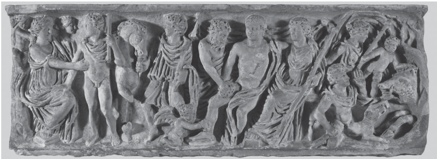
Figura 1. Sarcòfag d'Adonis. Part frontal. Barcelona. Museu d'Arqueologia de Catalunya.

però que, en relació amb les altres dues, ocupa, il·lògicament, una superfície més petita. Es tracta de la Cacera del senglar (figura 5), on el jove Adonis jau agenollat amb el tors tirat cap enrere i expressant el dramàtic moment del colpiment de la bèstia que surt del seu amagatall, mitjançant la gestualitat de la seva mà i la seva cara, alhora que Venus i un erote acudeixen per ajudar-lo. Trencant amb la representació frontal, els costats del sarcòfag (figura 6) presenten un baix relleu sobre un marc quadrangular que delimita els marges de la superfície i en el qual es presenten, en totes dues bandes, un escut de forma ovoïdal amb la vora rebaixada i disposat en diagonal sobre dues llances perpendiculars, en la part central del qual es representa un cap de medusa.