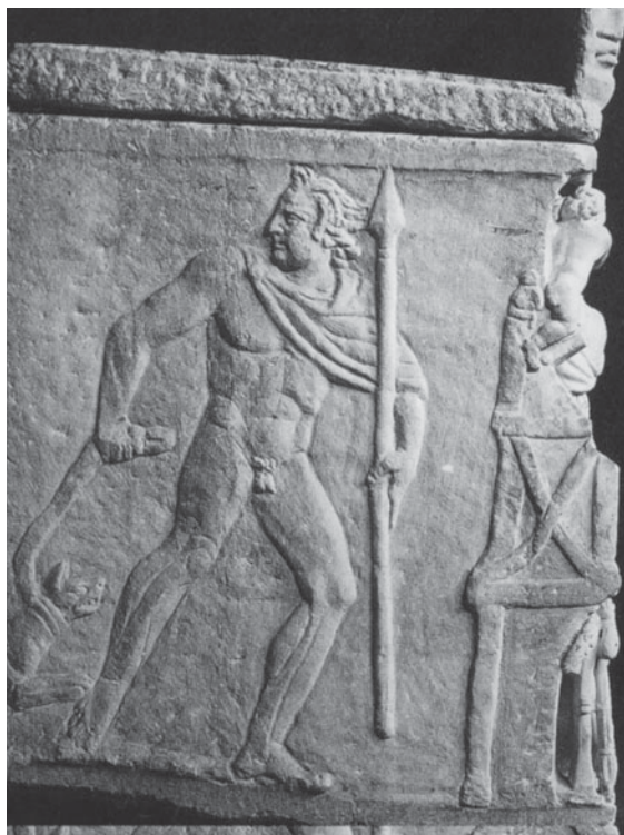
Figura 7. Sarcòfag d'Adonis. Part lateral. Roma. Museo Gregoriano Profano. Fotografia extreta de GRASSINGER, Die Mithologischen... , 1999, fig. 63,1.

Pel que fa al motiu d'escuts i llances, és genuï de les representacions secundàries dels sarcòfags de lleons 55 , malgrat que també es troba als laterals d'alguns exemplars amb representació de garlandes 56 . N'hem de buscar l'origen en l'art oficial romà, on constituïen símbols de victòria sobre els pobles doblegats per l'Imperi. Aquest motiu va ser adoptat per l'art funerari per indicar l'alt grau de virtus del difunt 57 . Als laterals de l'exemplar barceloní, hi observem un únic escut ovoïdal delimitat per una vora que no es correspon amb cap de les imatges conservades als sarcòfags romans, que mostren una morfologia més allargada i sempre es representen per parelles 58 , decorats amb sanefes de volutes o motius bèl·lics a sobre de les armes fiscalitzades als pobles bàrbars conquerits. Només el clipeus era representat de manera individual, atesos els condicionants de la seva forma arrodonida. La decoració també habitua a ser a còpia de sanefes de volutes i un umbo llis o traçat amb formes geomètriques 59 . Això no obstant, malgrat que té menys difusió, trobem exemplars dins els sarcòfags de garlandes amb la representació d'un escut amb el gorgoneion sobre dues llances perpendiculars 60 , si bé l'escut és sempre un clipeus i l' umbo mai no queda relegat a tan ínfimes dimensions com resulta al sarcòfag de Barcelona 61 .