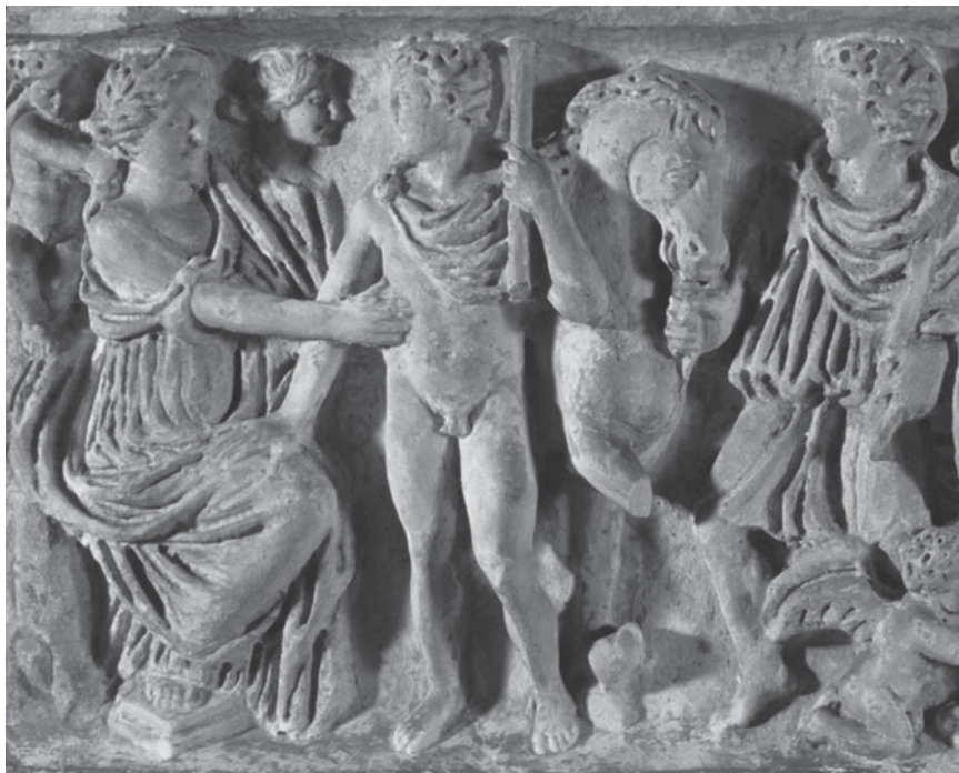
Figura 3. Detall de la part frontal: Acomiadament .