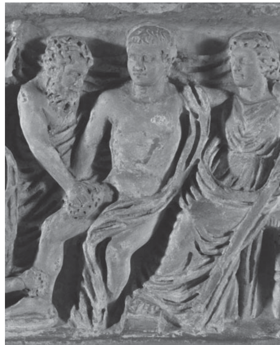
Figura 4. Detall de la part frontal: Apoteosi .

qual gaudeix el protagonista de l'episodi mític. Serà en aquest moment quan el retrat del difunt irromprà amb força en les representacions dels sarcòfags mitològics, substituint la faç de l'heroi o de la divinitat protagonista, de tal manera que l'esperança que s'aguaitava en representacions de sarcòfags anteriors que el difunt assolís la immortalitat, ara es torna manifesta en la creença de l'heroïtzació de la seva ànima, la qual cosa constitueix una al·legoria que desplaça el sentit mitològic de la representació 24 . El difunt venç les barreres de la mort terrenal gràcies a la virtus mostrada en vida i apareix com el protagonista d'episodis mítics, com ara el Rapte de Proserpina , o en venationes al·legòriques, com ara les d'Hipòlit, Meleagre o Adonis 25 . Els sarcòfags que contenen aquesta peculiar característica constitueixen un nombre molt limitat, ja que se circumscriuen a una cronologia, com ja hem dit, molt delimitada. Actualment, es conserven entre 62 i 68 exemplars d'aquest tipus, i de tots els sarcòfags d'Adonis que han arribat als nostres dies, només un, el del Museu Gregoriano Profano de Roma 26 , presenta l'heroïtzació del difunt emmarcant-la en una escena d'apoteosi 27 .