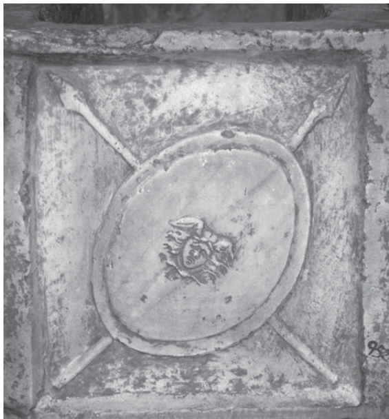
Figura 6. Sarcòfag d'Adonis. Part lateral. Barcelona. Museu d'Arqueologia de Catalunya.