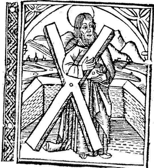
Figura 2. Flos Sanctorum de 1519. Sant Andreu.

il·lustració del llibre imprès durant el període 1500-1525 a Espanya. Gran part de les xilografies que il·lustren aquestes obres són utilitzades de nou en altres edicions per Jorge Coci, alemany i continuador de Pablo Hurus a Saragossa. A la vegada, Fadriquer de Basilea, Nicolau Spindeler o Leonardo Hutz també recorren a moltes de les seves xilografies. Vegeu F. VINDEL, El arte tipográfico en España durante el siglo XV , 9 vols., Madrid, 1945-1952. K. HAEBLER, Tipografía ibérica del siglo XV , La Haya-Leipzig, 1902. J. YELL, Early Book illustration in Spain . Londres, 1926. J.M. SANCHEZ, Biografía aragonesa del siglo XVI ,