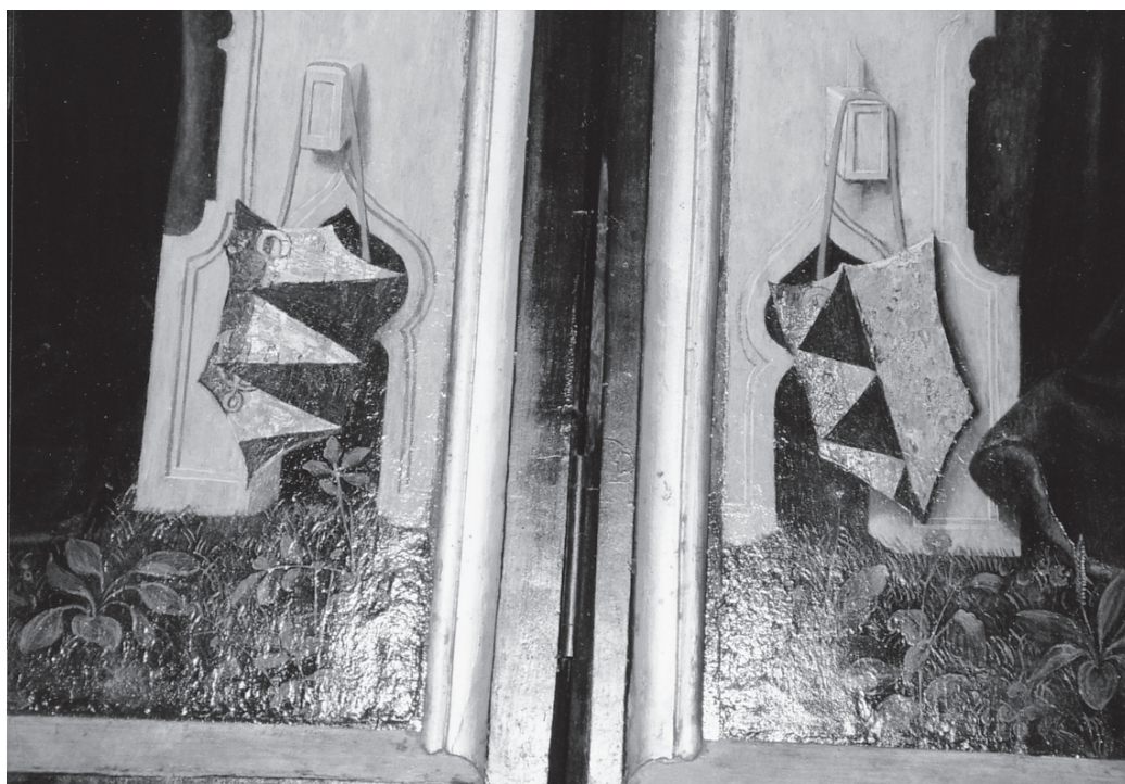
Figure 3. Attribué ici à Barthel Bruyn l'Ancien. Détail de la figure 1.