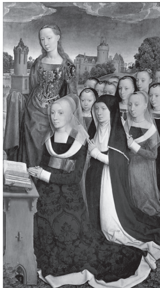
Figure 2. Hans Memling, Triptyque Moreel, volets avec donateurs et saints patrons . Bruges, Groeningemuseum.