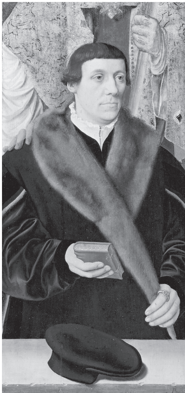
Figure 5. Barthel Bruyn l'Ancien. Triptyque, volet gauche avec donateur et saint patron. Cologne, Wallraf-Richartz-Museum.

Restaurateurs et antiquaires mirent au goût du jour ces oeuvres d'un autre âge. C'est ainsi que les volets avec donateurs et saints patrons furent souvent séparés de la scène biblique représentée sur le panneau central. En outre, on scia parfois les volets dans le sens de la largeur, de manière à «libérer» les portraits des commanditaires de l'effigie de leurs saints patrons. D'un «donateur présenté par son saint patron», on fit un «portrait» autonome et un «saint à mi-corps». Il arriva même que le fond du «portrait» obtenu de la sorte fut