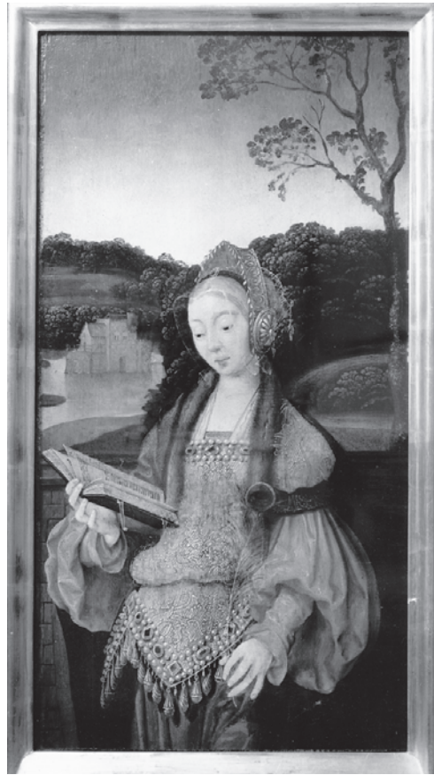
Figure 6. Entourage de Barthel Bruyn l'Ancien Volets de triptyque, saint Barthélémy et sainte Barbe . Utrecht, Rijksmuseum het Catharijneconvent.

recouvert, dans un second temps, d'une couche de couleur unie, de façon à dissimuler le corps mutilé du protecteur céleste et à donner à l'image l'apparence d'un authentique «portrait» moderne, sur fond neutre.