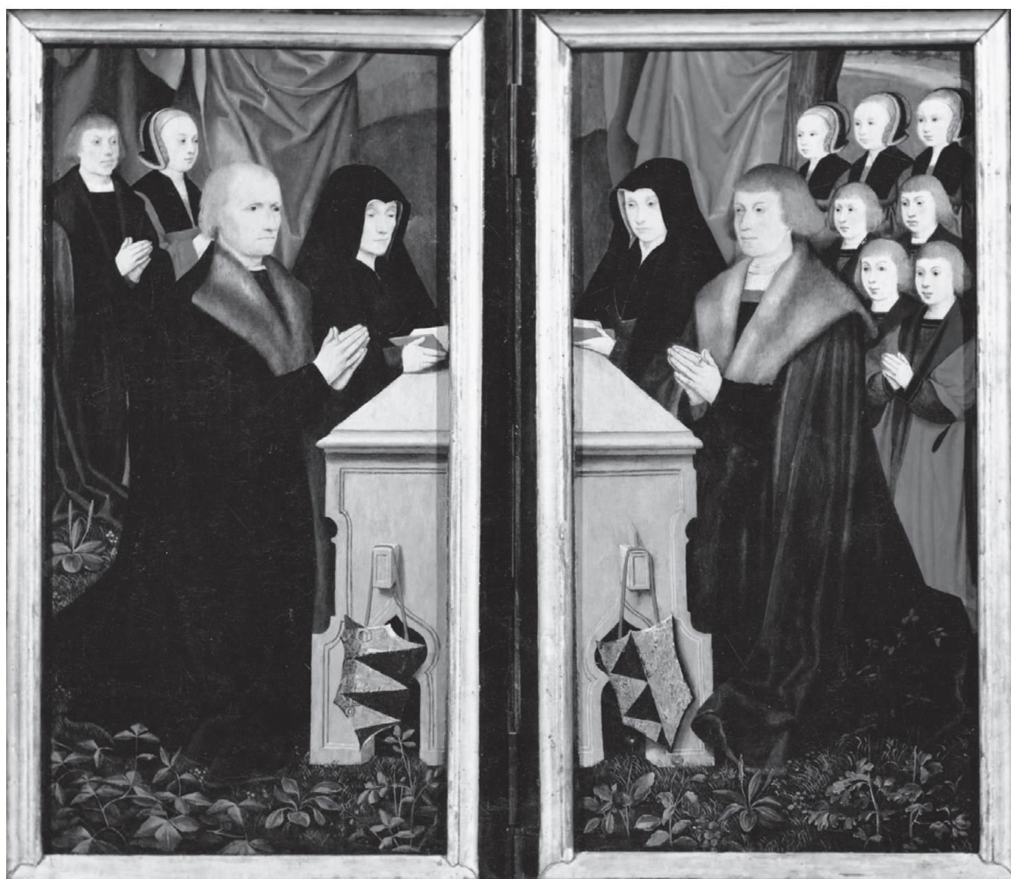
Figure 1. Attribué ici à Barthel Bruyn l'Ancien « Diptyque Mateu » donateurs et saints patrons. Peralada, collection Carmen Mateu.