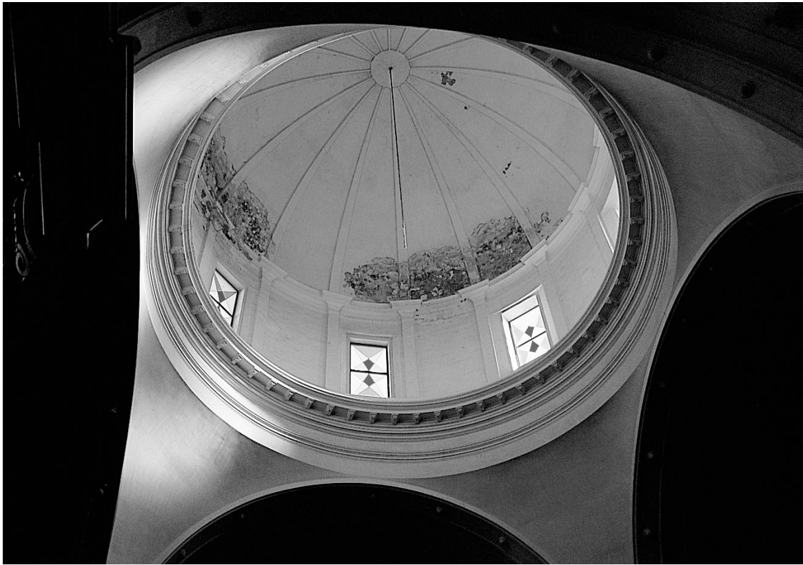
Figura 5. Cúpula.

30. SERRA MASDEU, Anna, op. cit., p. 66.