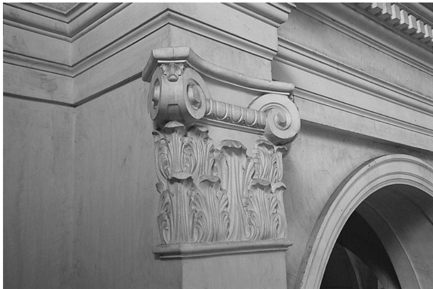
Figura 4. Detall d'un capitell compost.