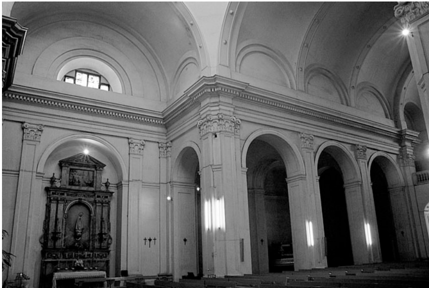
Figura 2. Detall de la nau central del temple.