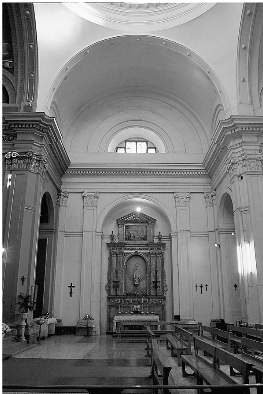
Figura 3. Braç dret del creuer.

Antes, al tratar del papel del despotismo ilustrado en el campo de la Arquitectura, insinuaba cómo una de las principales misiones de la Academia consistió en difundir, imponiendo casi, los ideales del clasicismo. Para ello, y a través de la Comisión de Arquitectura de la Academia —para las obras de utilidad pública que habían sido resueltas de manera insatisfactoria— eran encargadas a un individuo de confianza que formaba los nuevos planos bien desde Madrid, sin moverse del lugar para posteriormente mandarlos, o por el contrario se delegaba en ciertos Arquitectos distribuidos por toda España. Vinculados estos últimos a la Academia, sus obras, igual que las de cualquier otro, tenían que pasar por la Comisión de Censura pero eran casi sistemáticamente aprobadas. De este modo España se repartía entre unos cuantos arquitectos que cubrían un territorio: Antonio Sanz era el hombre de