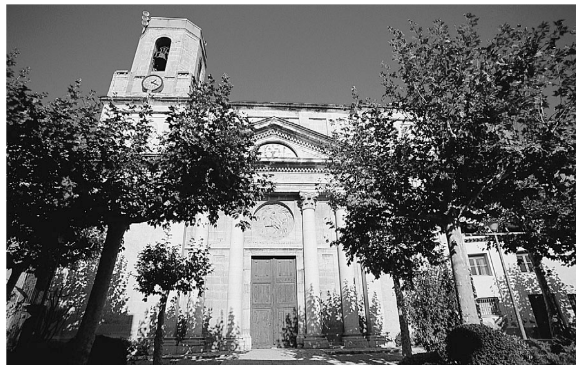
Figura 1. Façana de l'església parroquial de Sant Martí de Vilallonga.

imatge que oferia Tarragona als ulls dels viatgers de final del segle XVIII era la d'un nucli tancat, descurat i pobre 2 .